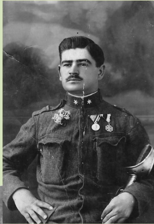
A húsz éves ifjú katona.