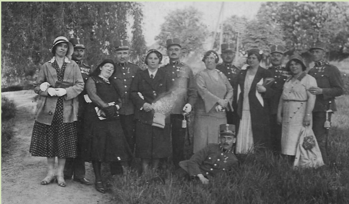
A szombathelyi őrsparancsnokképző iskola végzős diákjainak egy csoportja, feleségeikkel.