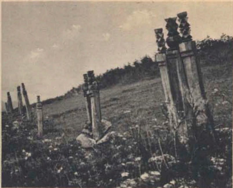
Kopjafák Magyar Valkón