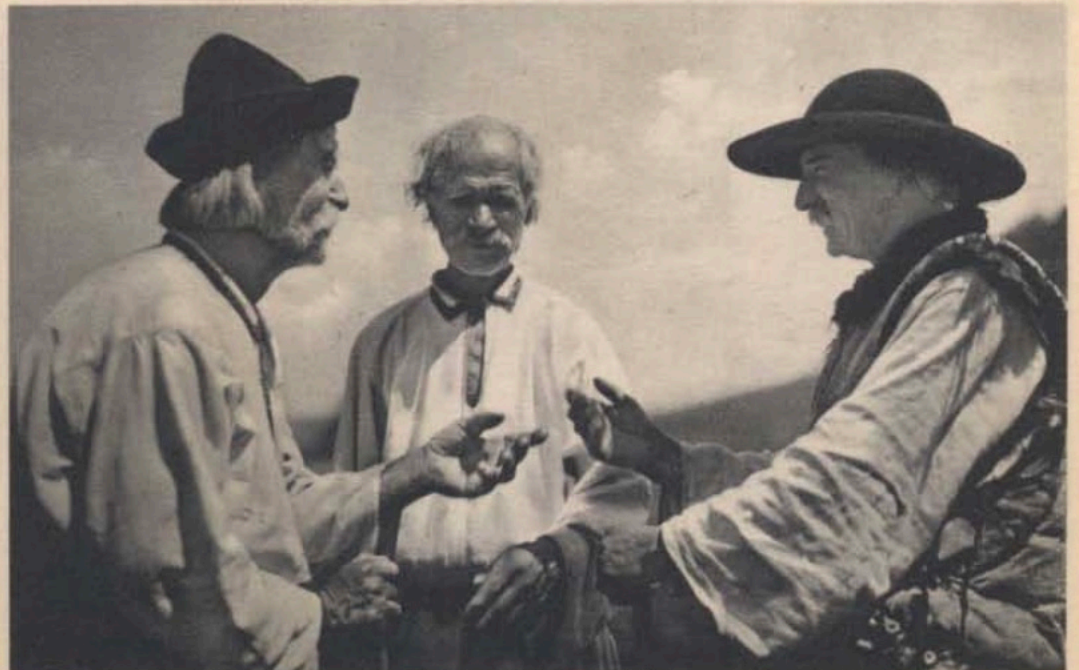
Csángó asszonyok és férfiak