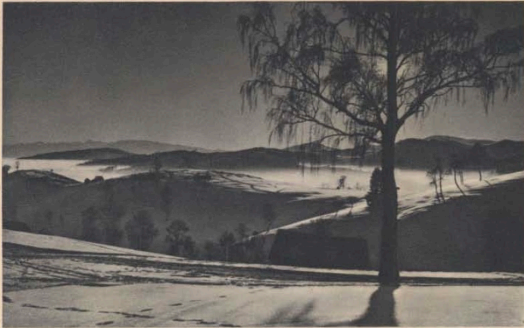
Holdvilág a havasokon