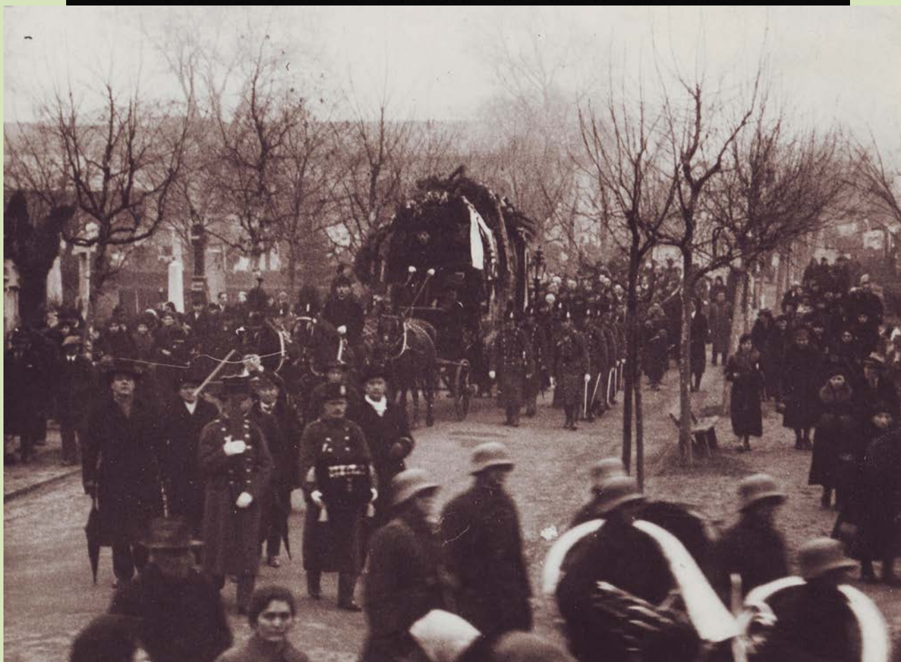
Dédunokája, Etelaky Gábor Zuárd gyűjtése alapján

Nyomt. Buschmann F. utólag IV. ker., Molnár-utca 37. szám