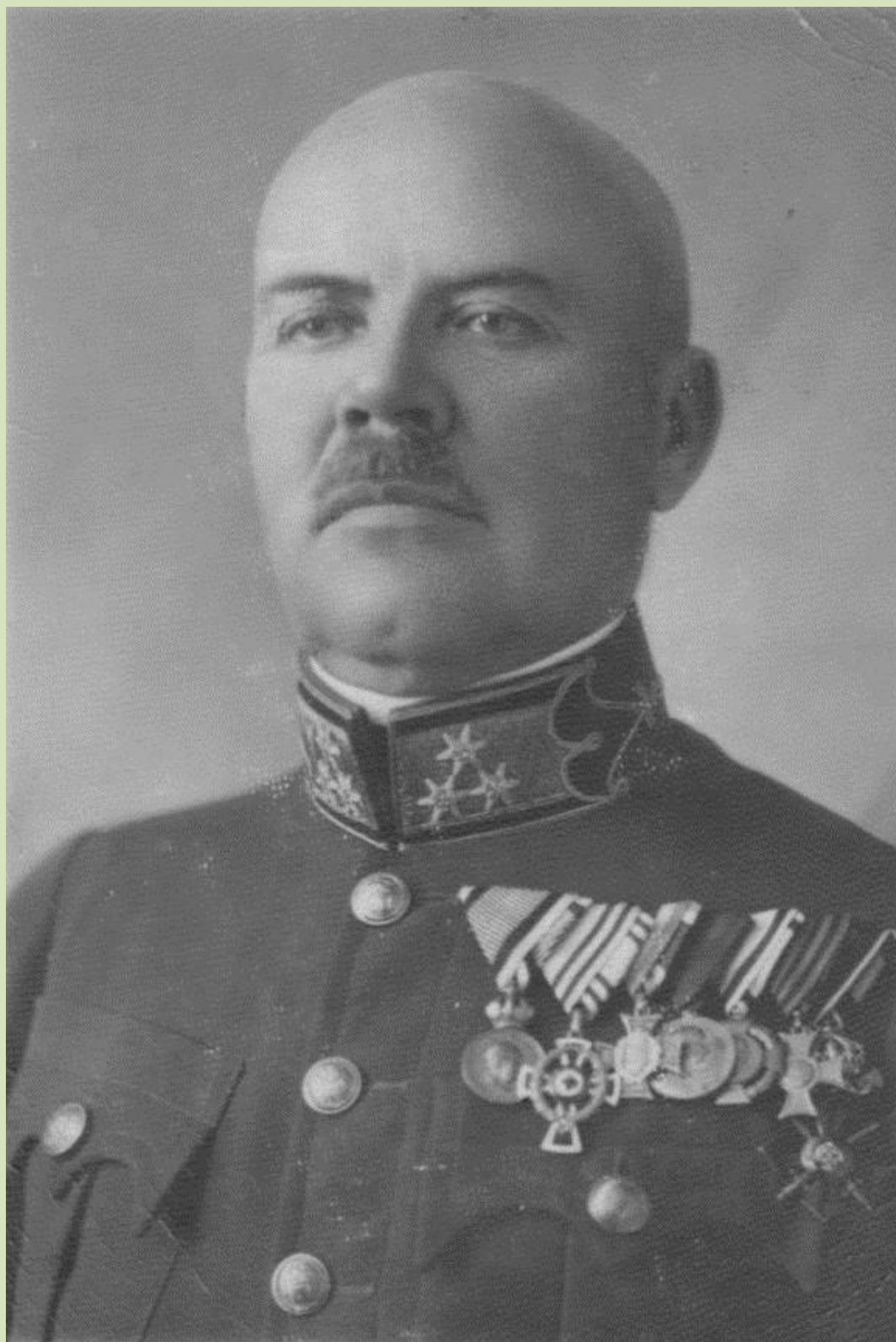
Hegedüs Gyula m. kir. csendőr ezredes