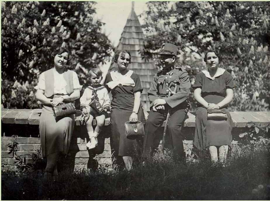
Miskolc, 1937. Avasi séta rokonokkal.