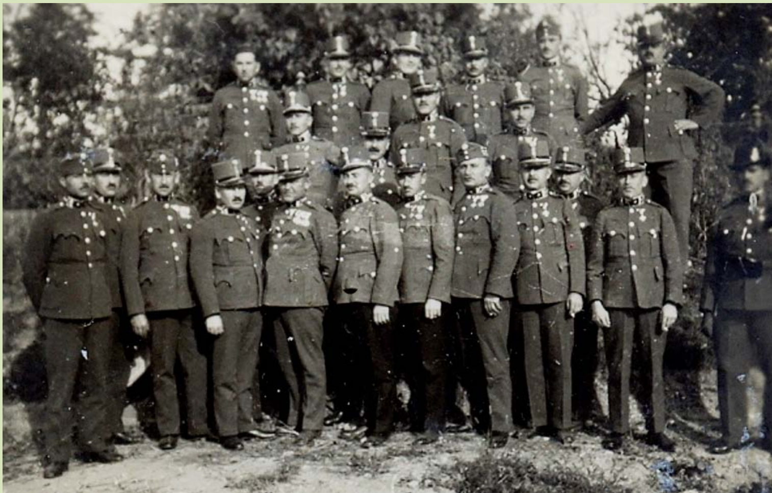
Az órparancsnok képző tanfolyam végzett hallgatói. Szombathely, 1937.