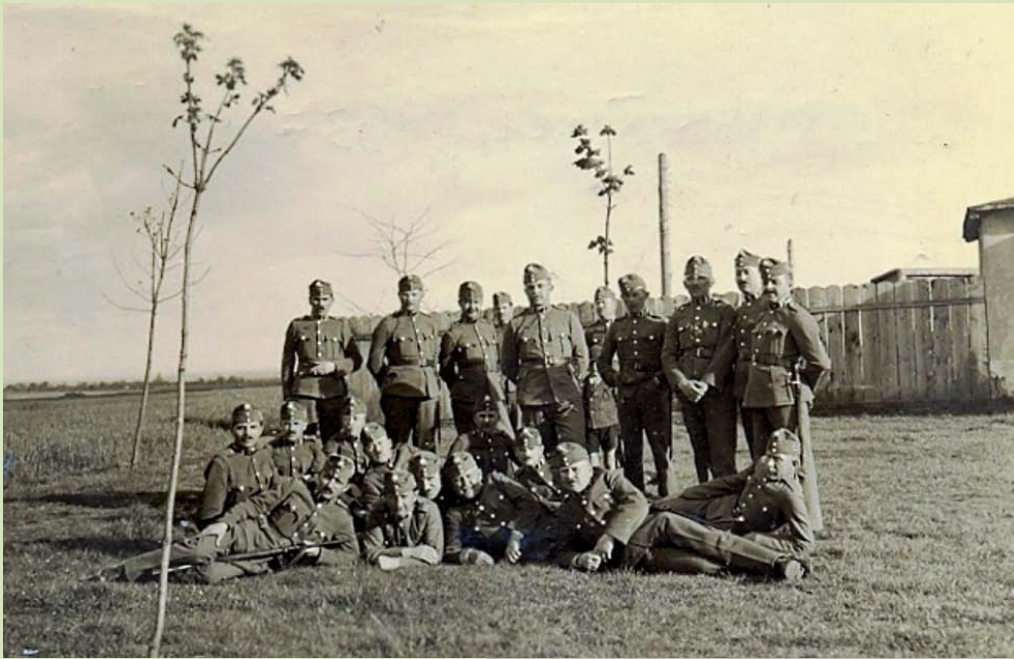
Őrsparancsnokképző tanfolyamon, Szombathely, 1937.