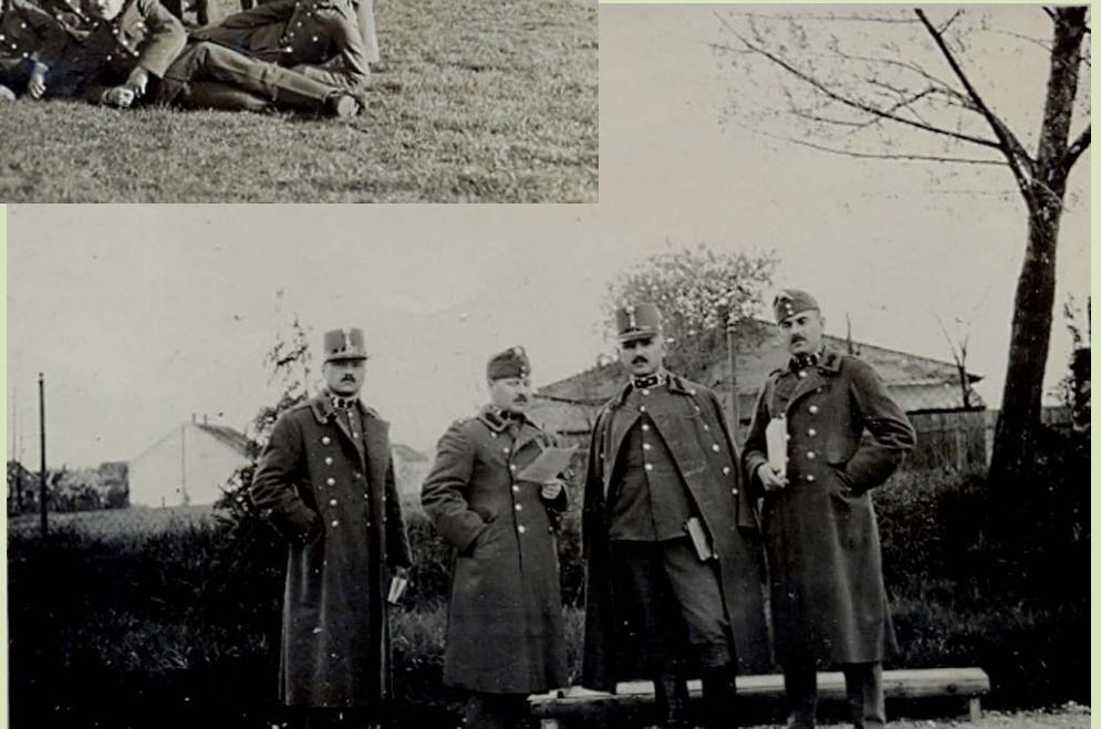
Szombathely, csendőrnapi felvonulás, 1938.