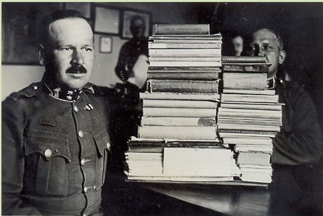
Vizsga előtt. (Az órparancsnok képző tanfolyamon ezeket kellett megtanulni.)