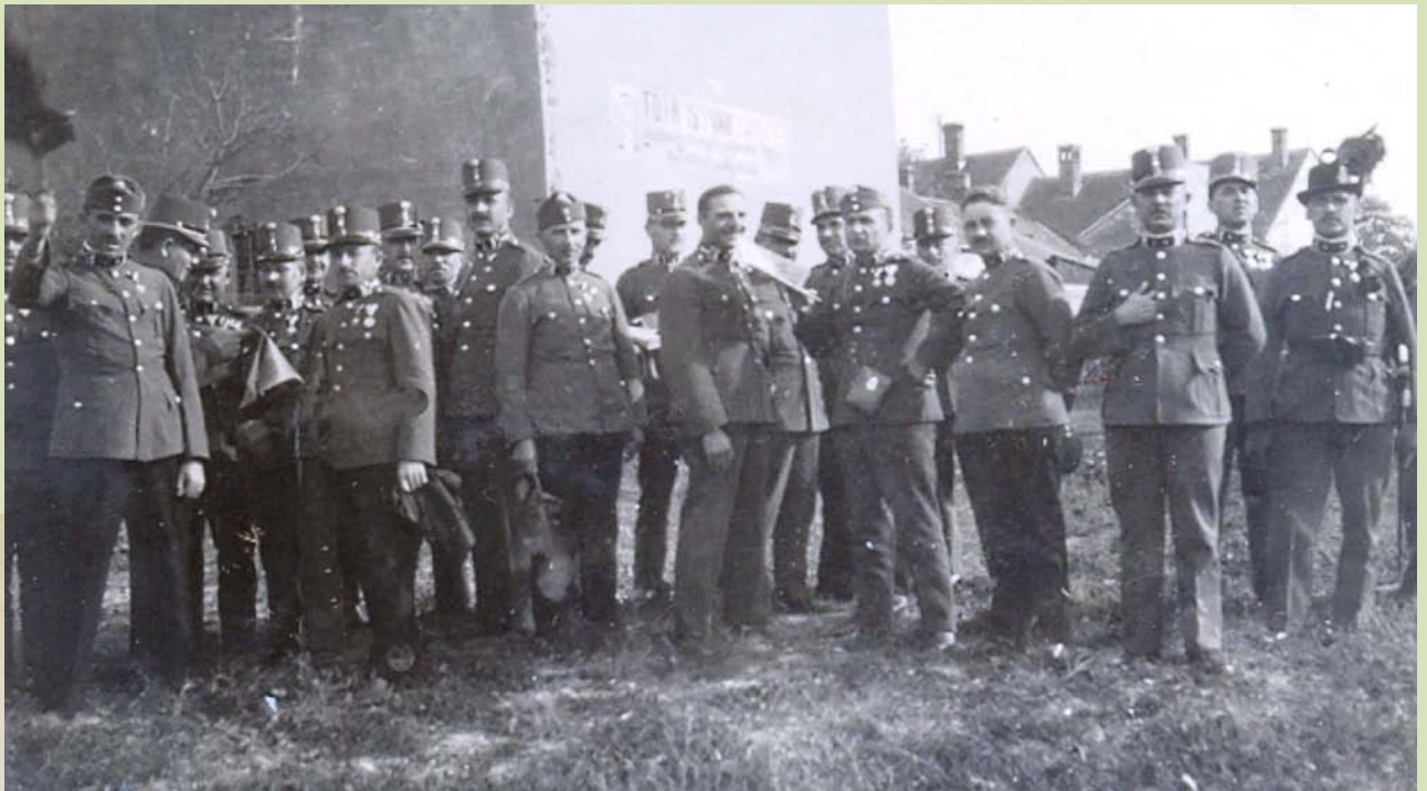
Őrsparancsnok képző tanfolyam. Szombathely, 1937.