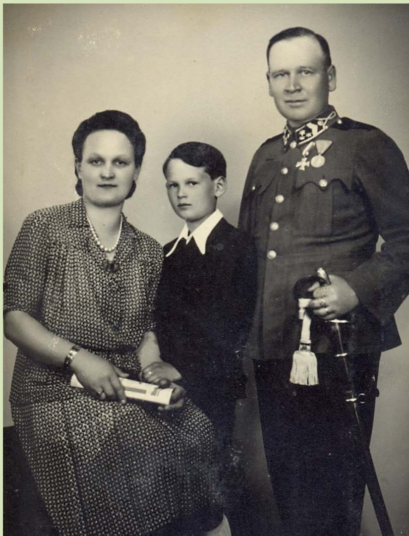
A család, 1944.

Szigorú, tekintélyes parancsnok volt, beosztottai szerették, az előjárók elismerték munkáját. Erről tanúskodott két dicséző okirat. Jó kapcsolat volt a helyőrségben lévő katonákkal, csendőrökkel és rendőrökkel. Egy alkalommal a csendőrség akkori főfelügyelője, Faraghó altábornagy (később vezérezredes, moszkvai katonai attasé, majd az 1945-ben megalakult kormány közellátási minisztere) megszemlélte az őrsöt és ez alkalommal is dicséző okirattal ismerte el szolgálatát.