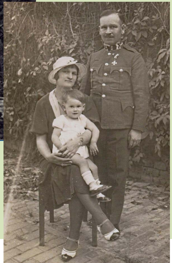
A család Szegeden, 1934