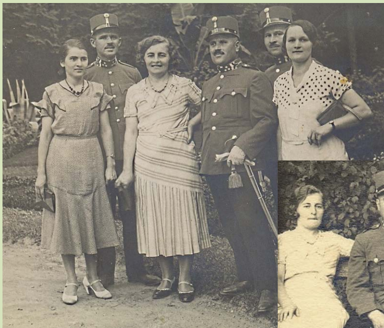
Szegeden, baráti körben, cc. 1932