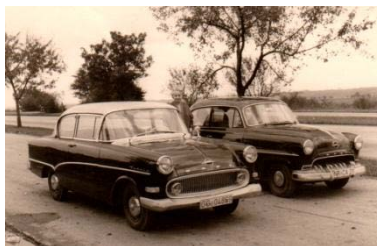
Az utolsó két autója Rheinbrohlban.