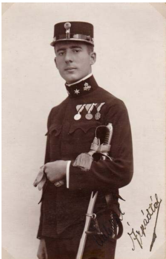
Körmeny Árpád, 1918.