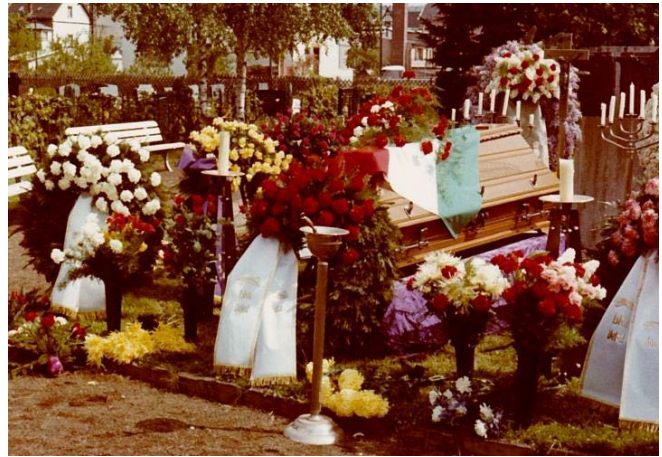
Édesapám temetése 1970. május 22-én Rheinbrohlban.

Édesapám fiatalkorától kezdve hazája s a csendőrség hűséges szolgálója volt. Ezt négy háborúban, és tizenegy békeidőben kapott kitüntetése bizonyítja. Horthy Miklós kormányzó úr "Dicsérő Elismeréssel" tüntette ki. Tiszti Személylapján minősítése minden beosztásában szinte kivétel nélkül "kiváló". A MKCSBK-nek 1954. június 8-tól tagja és munkatársa volt. 1965. június 27-től édesanyámmal együtt a Szent László Társaságnak is tagja lett.