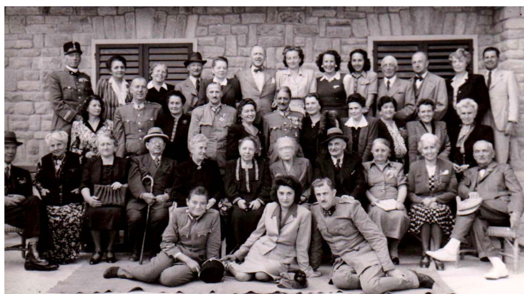
A hévízi csendőr gyógyház nyaralói 1944.07.31. Édesapám a 2. sorban balról a 2., édesanyám fent jobbról a 7., én alul balról az 1.