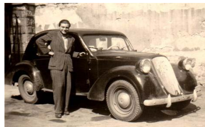
Steyr 200-as kocsí vezetője. Budapest, 1953.

Az én magyarországi sorsom röviden vázolható. Gyulán 1949-ben sikeresen leérettségiztem. Az akkori politikai helyzetben származásom folytán már "népellenségnek" minősítettek s egyetemre sehol sem vettek fel. Budapesten, ott élő rokonaim segítségével, segédmunkási állást kaptam egy államosított víz- és fűtésszerelő üzemben. Itt rövidesen átvettek gépkocsivezetőnek, ami eredeti célom volt. A gépkocsivezetői vizsgát már Gyulán lettem.