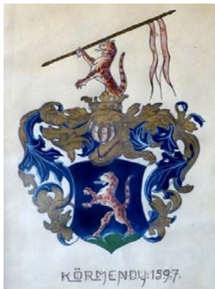
A Körmeny család címere.

Édesanyám továbbra is Rheinbrohlban maradt, bár teveztük, hogy esetleg átköltözne Wolfsburgba. Hűséges baráti köre és számos magyarországi rokonlátogatása segítette lelki fájdalma elviselését. Rövid betegség után, a linzi kórházban 75 éves korában, 14 év után, 1984. március 22-én követte szeretett élettársát Teremtőjéhez. Édesapám mellett közös sírba temették. Sírhelyüket már nem lehetett meghosszabbítani, ezért 2016. elején le kellett bontatnom. Ezzel utolsó földi nyomuk is megsemmisült. Csupán szívünkben él felejthetetlen emlékük.