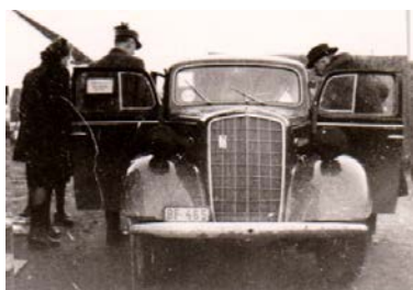
Utolsó előkészületek indulás előtt, 1945.

Édesapám érdeklődési körébe tartozott az úszás, kerékpározás, fényképezés, filmezés, de főképpen minden fajta gépjármű. Már fiatal hadnagyként volt motorkerékpárja, majd oldalkocsis motorkerékpárja. Ezt követte első autója, egy kétszemélyes nyitott Opel. Sok száz méter filmje, javarészt családi felvételek, maradéktalanul elvesztek. A nagyváradi szolgálati lakásukból bevagonozott teljes berendezésüket szombathelyi családi házában akarta édesapám elhelyezni. Ezt a házat 1931. szeptember 25-én vásárolta családjának.