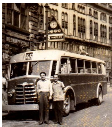
FAU NIK TR5-ös autóbusz vezetője, baloldalon. Budapest, 1955.

A gépkocsivezetés nemcsak édesapámtól örökölt kedvenc foglalkozásom volt, hanem a rendszertelen munkaidőmnek köszönve elkerültem az állandó kötelező politikai oktatásokat, gyűléseket. Húsz éves koromban behívtak katonának. Két évet mint tehergépkocsi vezető szolgáltam le. Leszerelésem után visszatértem régi üzememhez személygépkocsi vezetőnek. 1953-ban a fővárosi autóbuszüzem buszvezetőket keresett azújonnan beállított autóbuszaira. Ide jelentkeztem, s a vizsgák sikeres letétele után autóbuszvezető lettem. Az 1956-os forradalom letörése után, egy politikai