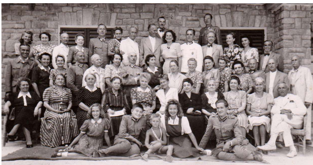
A hévízi csendőr gyógyház nyaralói 1943-ban. Édesapám fent balról az 5., édesanyám fent jobbról a 3., én alul balról a 2.