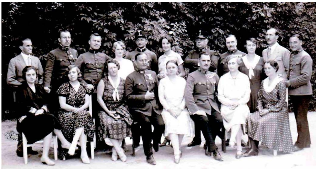
A hévízi csendőr gyógyház nyaralói 1930. június 25. Édesapám hátul balról a 2., édesanyám alul balról az 1.