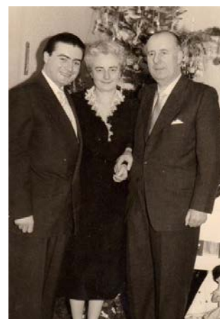
1956. karácsony. Együtt a család.