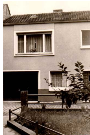
Családi házunk Rheinbrohlban Grabenstr. 6b, 1961.