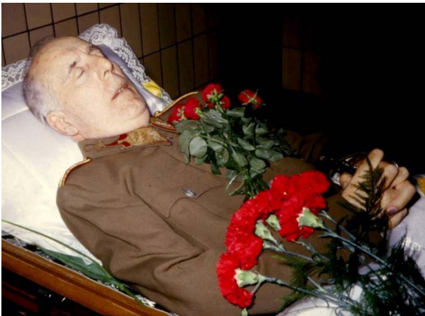
Édesapám nyitott kopszójában.