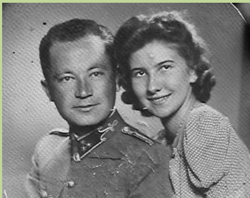
Eljegyzés: Szombathely, 1942. június 4.