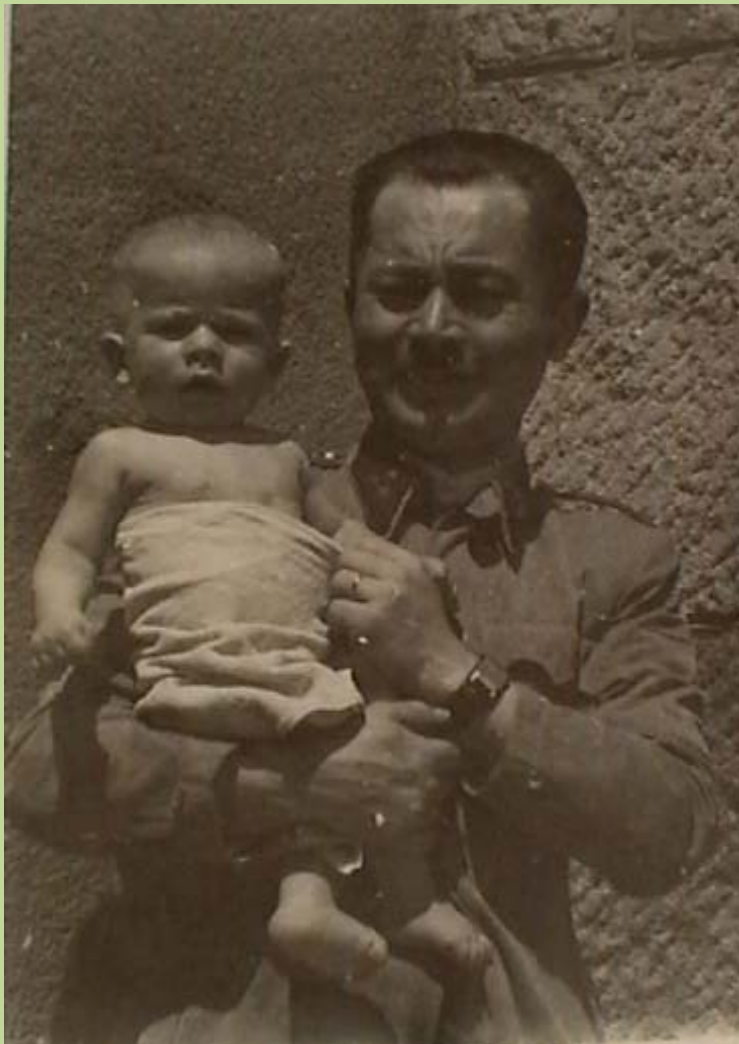
A két „Gyuri” 1944. május (már potyognak a bombák)