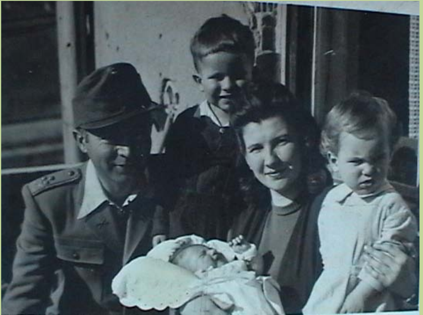
Boldog család, 3 gyerekkal!