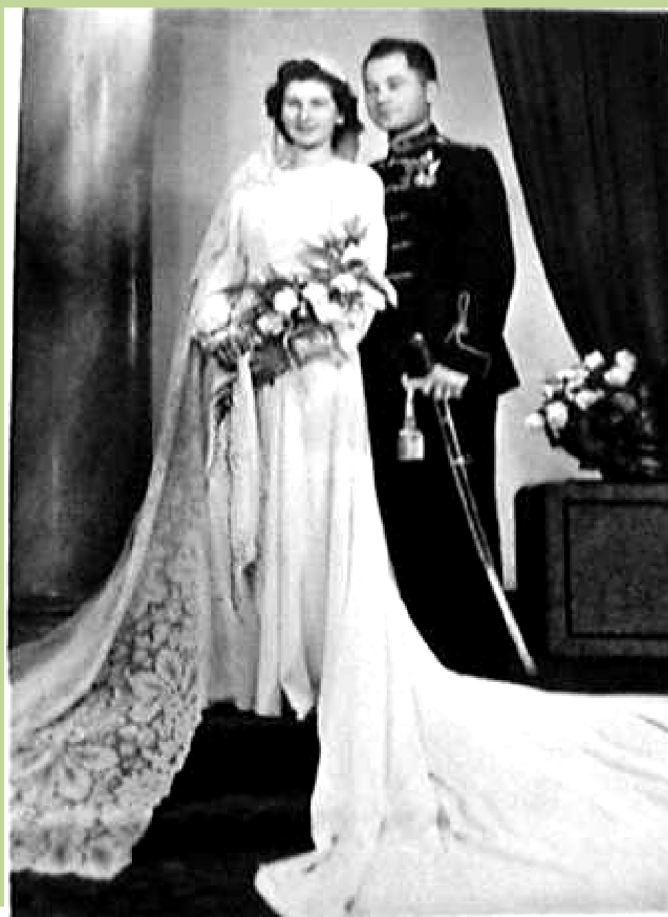
Esküvő: Budapest, 1942. dec. 19.