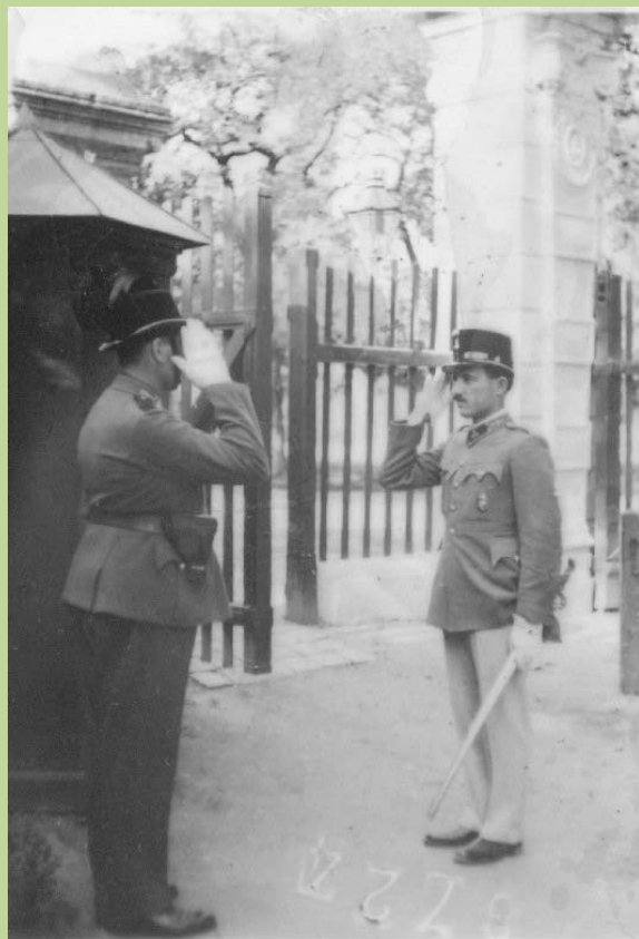
A gödöllői Grassalkovics kastély bejáratánál.