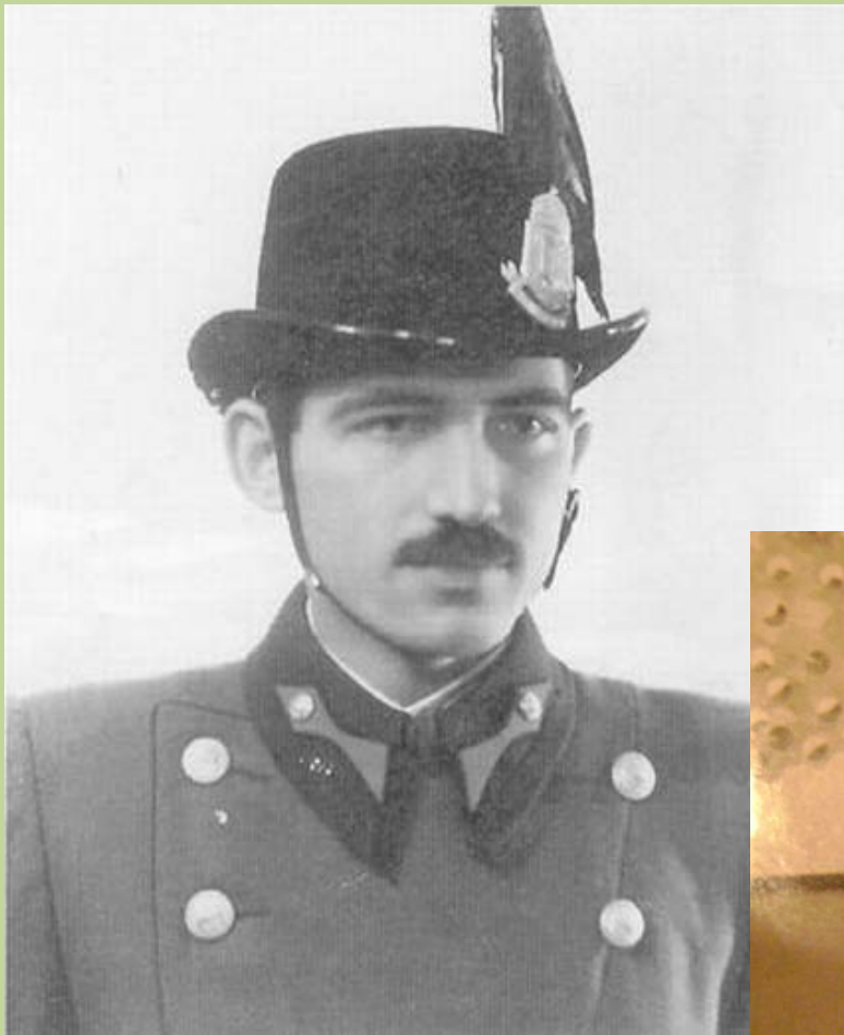
Csendőr százados szárnyparancsnok, Gödöllő, 1941-1944.