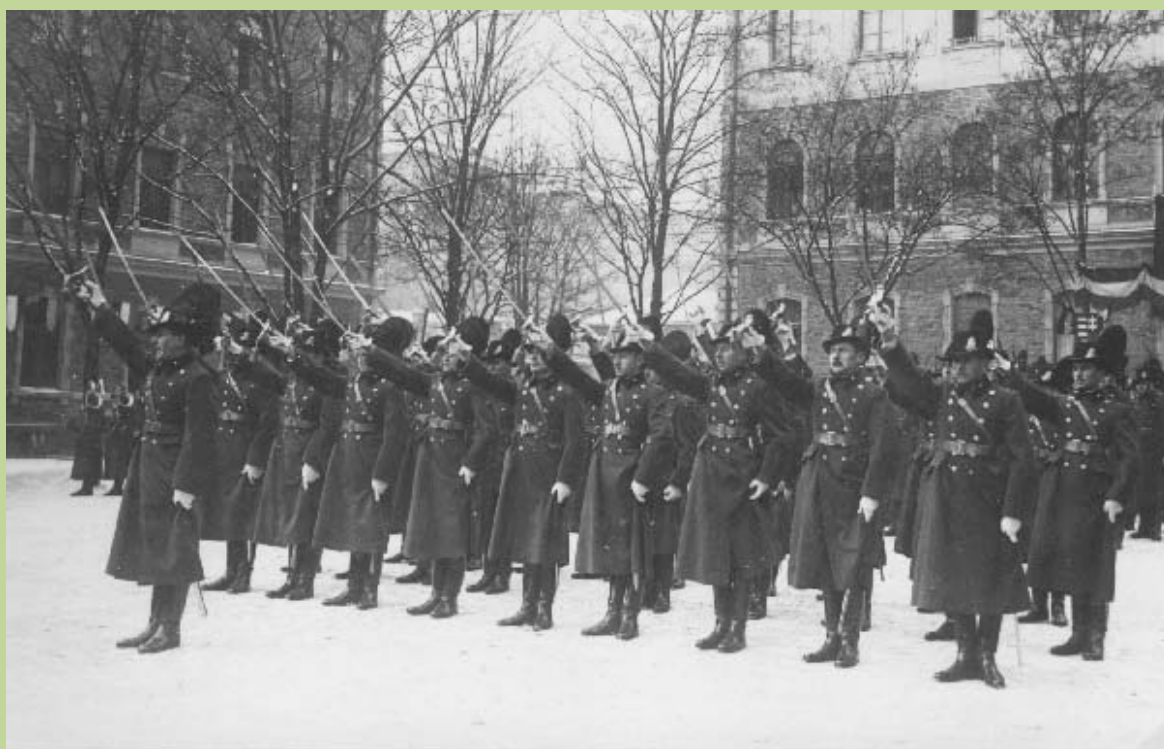
Böszörményi út; Csendőrtiszt avatás, 1938.

A Ludovika elvégzésével 1937-ben hadnaggyá, majd a csendőrtiszti tanfolyam elvégzése után 1938-ban főhadnaggyá avatták.