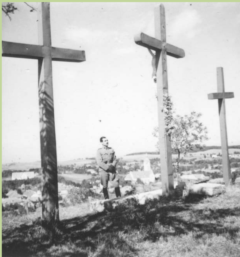
A szárnyparancsnok fohásza a Kerepesi Kálváriánál 1943-ban.