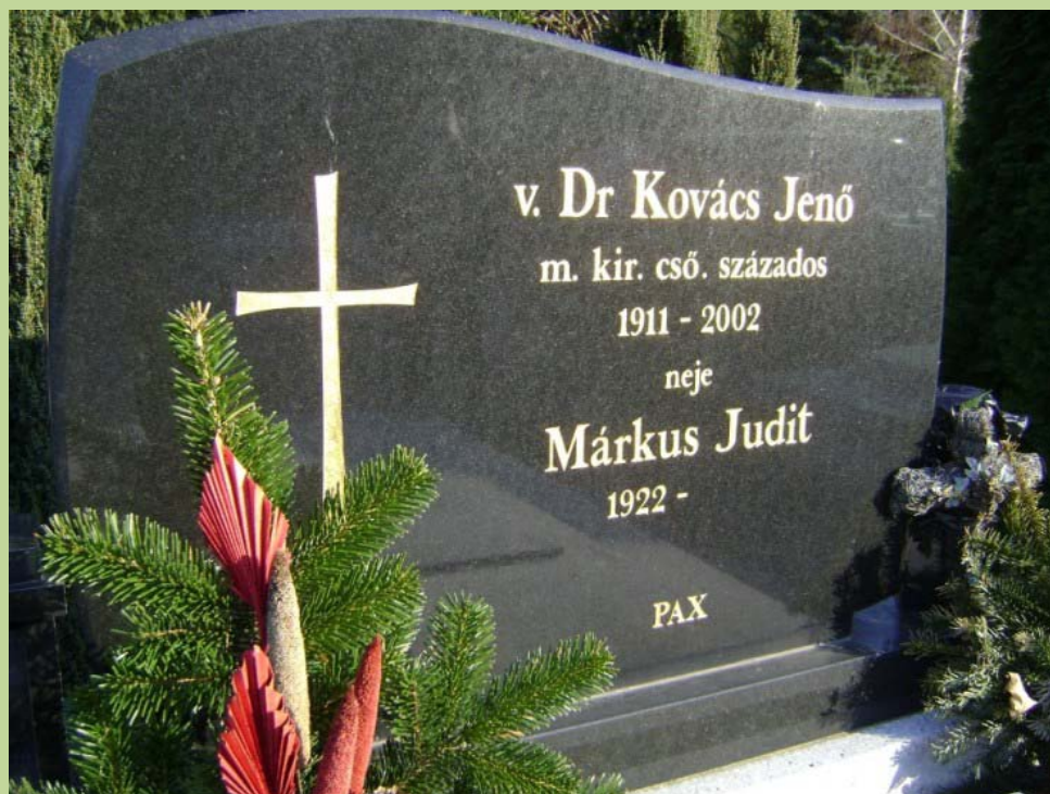
Testének nyughelye Szombathelyen a Jáki temetőben.

2002. október 4-én, 92. életévében Szombathelyen halt meg rövid kórházi ápolás után.