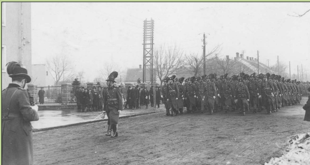
Szombathelyen a csendőrnapi díszszázadot vezeti. 1941. február 14.