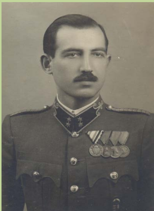
Főhadnagy, 1941 tavaszán.

Bácskai tevékenységét a M. Kir. Csendőrség felügyelőjének ügyészsége az újvidéki tisztoगतást követően átvizsgálta és megállapította, hogy azon eseményekben nem vett rész és feladatait minden esetben szabályszerűen látta el (1. Melléklet).