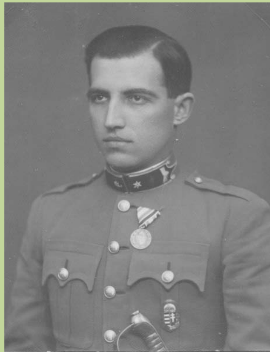
Ludovikás karpaszományos hadapród őrmester, 1937.

A Ludovika elvégzésével 1937-ben hadnaggyá, majd a csendőrtiszti tanfolyam elvégzése után 1938-ban főhadnaggyá avatták.