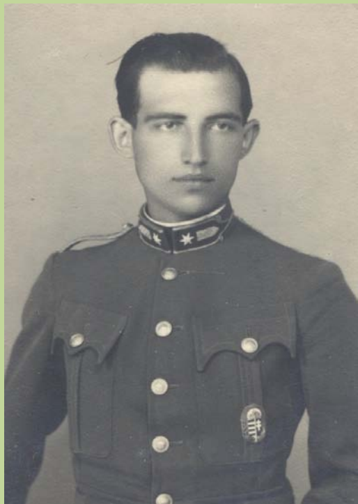
Honvéd zászlós, 1936.

1936-ban, nehéz anyagi helyzetében jelentkezett a közlönyben megjelent, csendőrségi és vasúti tiszti diplomásokat kereső álláshirdetésekre. A felvételiket követő csendőrségi válasz előbb érkezett, ami egész későbbi sorsát meghatározta.