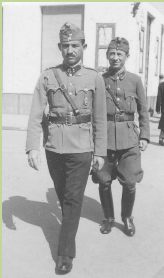
Erdély visszatér. Nagyváradon, 1940 szeptemberében.