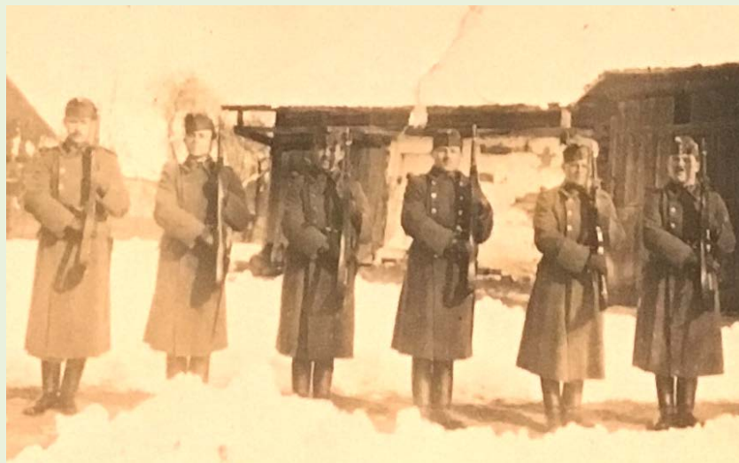
Próbacsendő Biberfalván, majd Kányádon (jobbaldalon), honvéd tizedesi ranggal, 1937-1938.