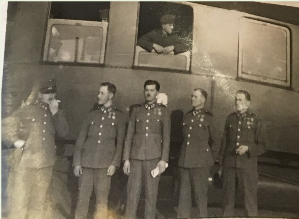
Bajtársakkal, Salgótarján, cc. 1940.