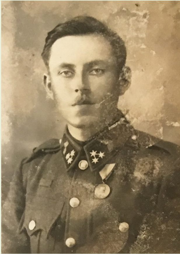
Véglegesített csendőr, jobboldalon járőrben. Nyírbogdány, 1939.