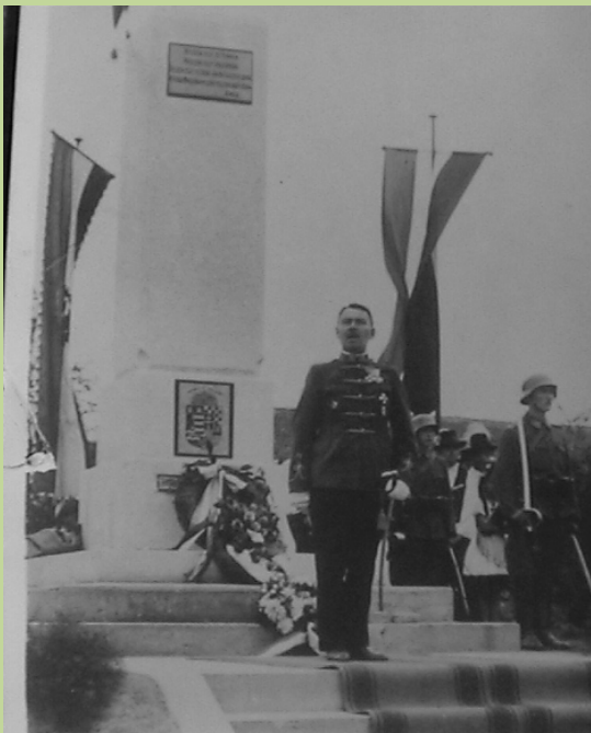
A Délvidék visszatérése után szülővárosában, a Duna-Tisza összefolyásánál lévő Titelen emlékművet állítanak, amelynek avatásán őt kérték fel a díszbeszédre