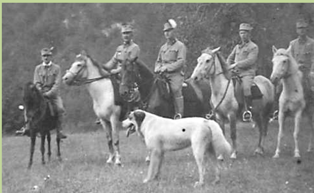
Praksz (1926-tól Poltáry) fhdgy. közepén, a fehér határvadász tollal, 1915

1908-ban zászlóssá avatták és az albán határ közelében, a Hum-tól nem messze fekvő sziklás Trebinjében, a soproni 76-os ezred 2. határvadász zászlóaljában kezdte meg szolgálatát, s hordta büszkén a határvadászok tollas csákóját.