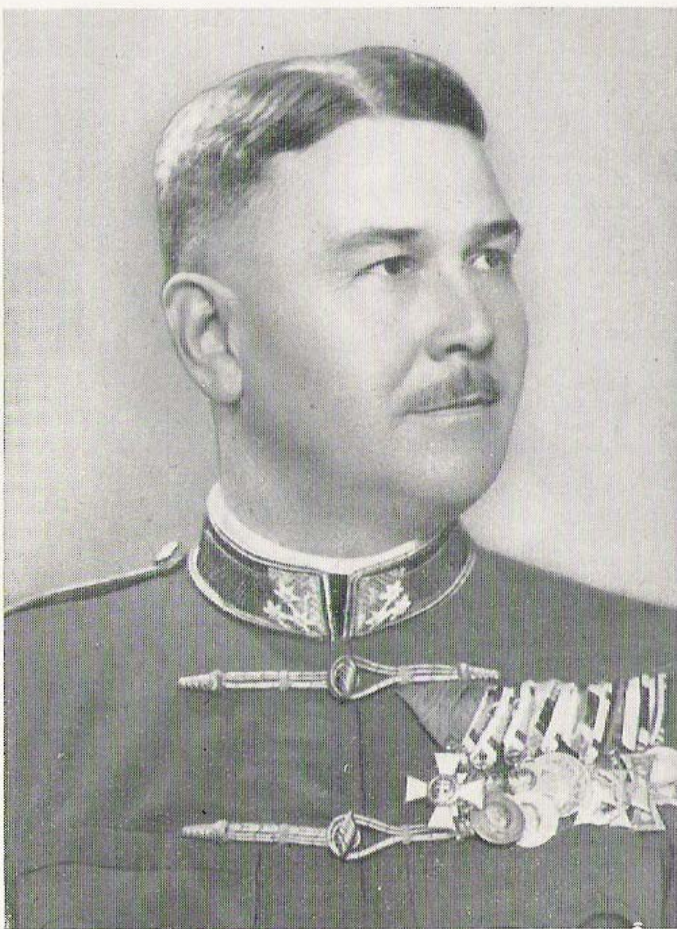
Arcképe az 1940. évi csendőrségi Zsebkönyvből