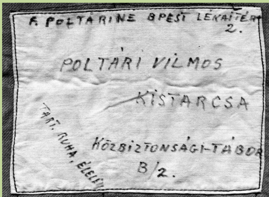
Ilyen címzésű zsákokban kellett küldeni a letartóztatottaknak a ellátmányt

július 17-én éjszaka, az ágyból kihúzva tartóztatták le és vitték Kistarcsára őriztbe. Egy Pobjeda-val – a szovjet autógyártás „Győzelem” névre keresztelt, Ford licenc alapján gyártott kocsija – mentek érte. A Pobjeda hátsó ülésén, ahogy beült, egy jól ápolts pisztolyra ült rá. Automatikus odanyúlt, de rögtön kapcsolt, s szólt, „valamelyiküknek kiesett a pisztolya!” „Megtalálta a pisztolyt” szólt hátra a legközelebb álló. Hogy mit