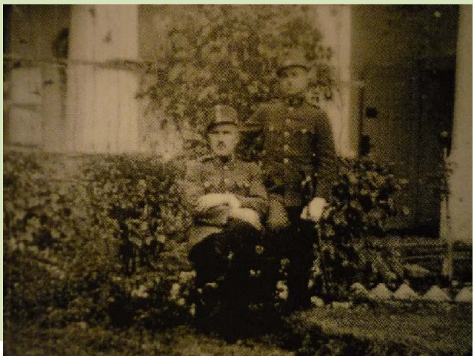
Véglegesített csendőrként, őrsparancsnokával