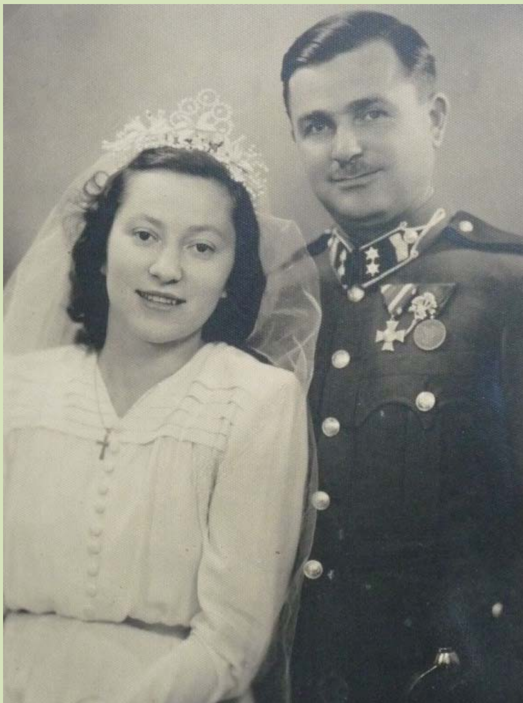
Törzsőrmester, őrsparancsnok, nejével