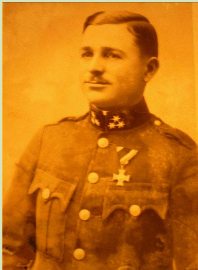
Véglegesített csendőr, kimenőben