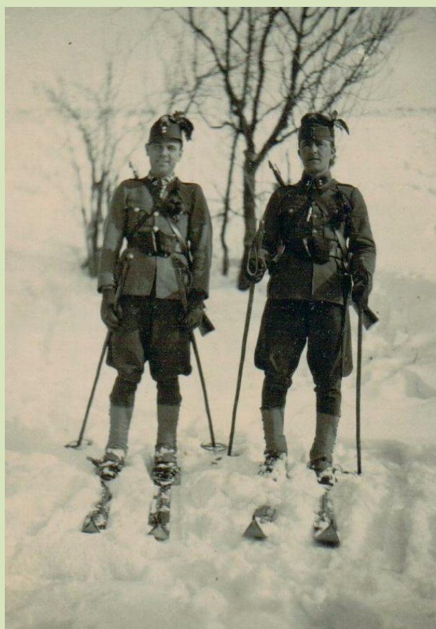
A Kárpátokban 1941 telén.