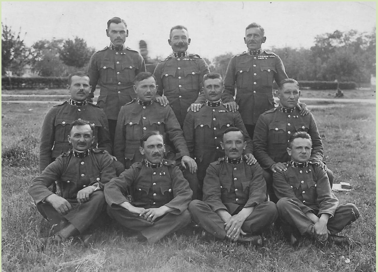
Törzsőrmenterek csoportja a szombathelyi őrsparancsnoki iskolában, 1938.