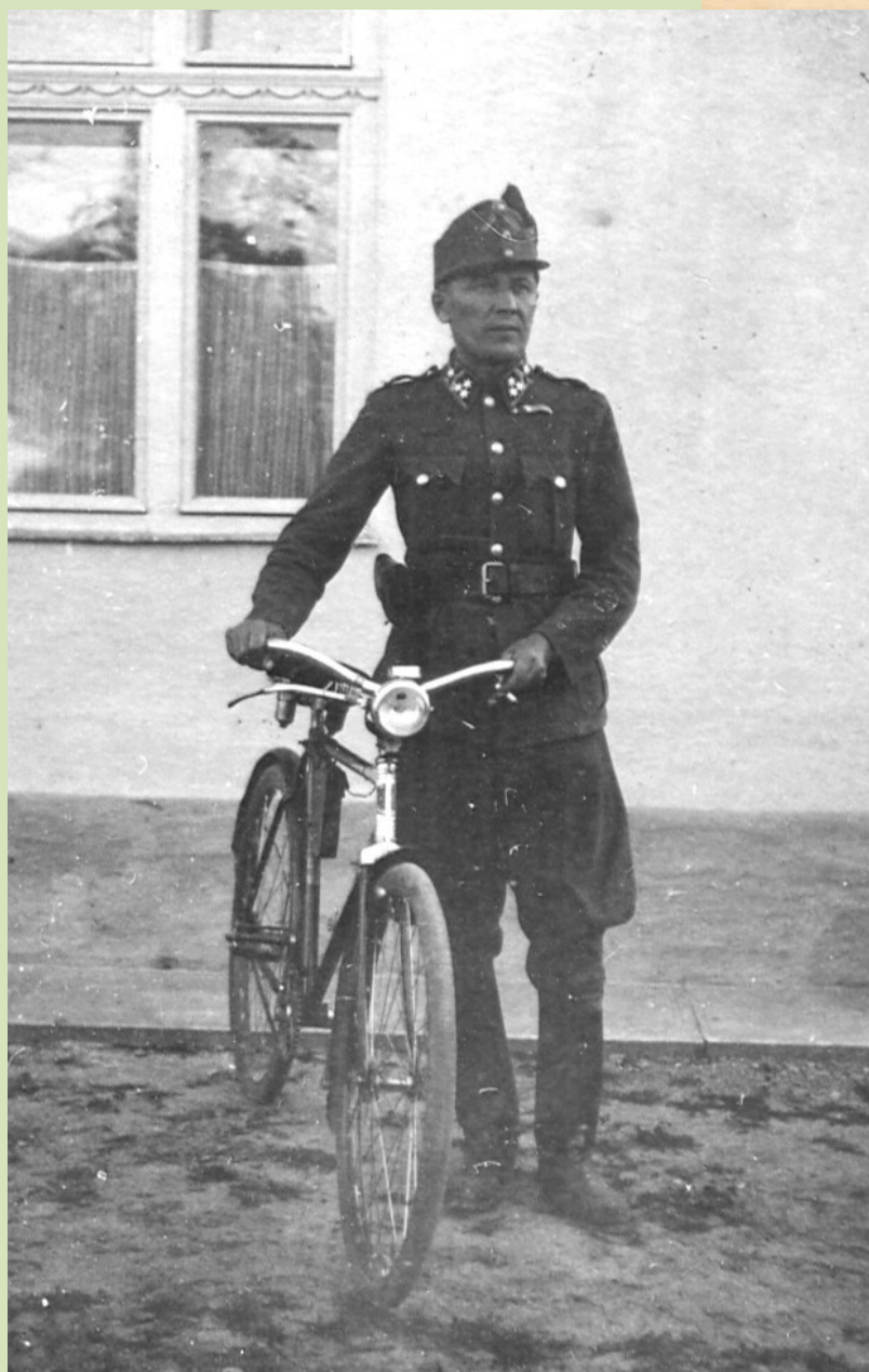
Az őrsparancsnok a járőr ellenőrzésére indul.