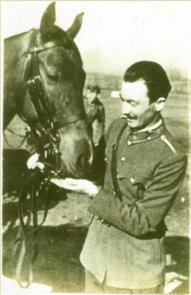
A lovaglás nagy kedvelője „Kisasszony” nevű lovával.