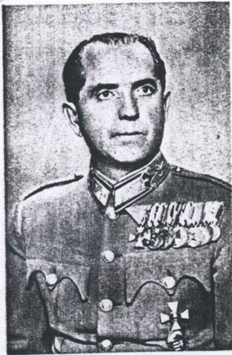
vitéz BALÁZS-PIRI GYULA ezredes, a m. kir. szombathelyi III. csendőrkerület parancsnoka.