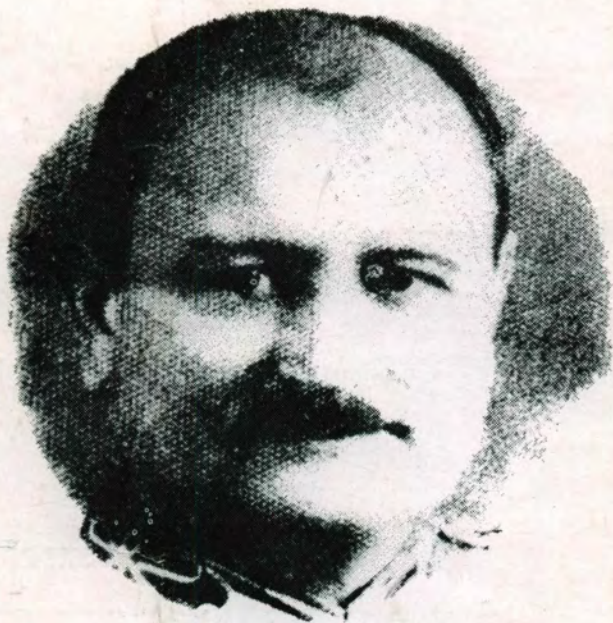
KUDAR LAJOS (1895–1945)