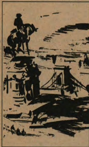
Gönczi Béla rajza

Az osztrák területen elhelyezett francia hadifoglyok