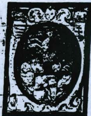
TAMASKA a régi magyar nemesség.

[Handwritten signature] állami közjegyző.