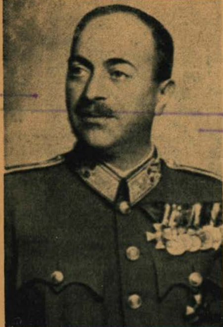
vitéz Temesváry Endre vezérőrnagy sírja a koszorúzás után Strassbourgan.