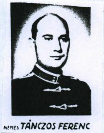
FARKASRÉTI-TÉMEŐ PERJÉSI FEVÉTELE