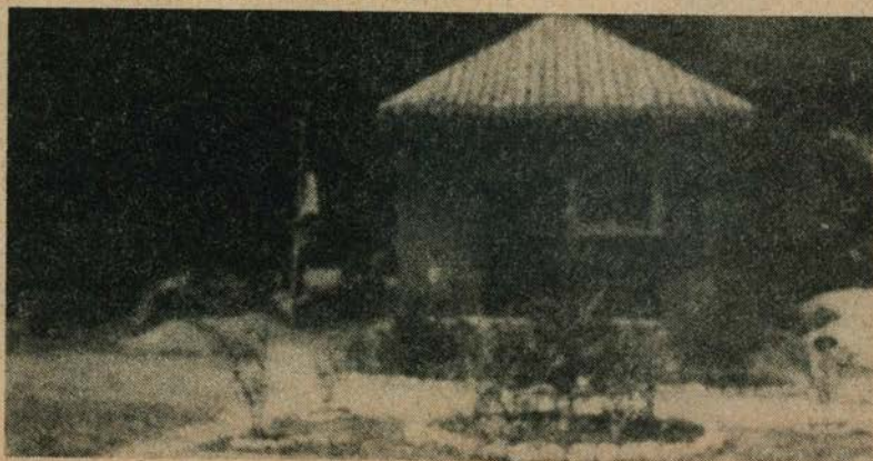
Táborrészlet. Traunfall 1945

Kimutatások, jelentések, egyéb írásbeli adatok bizonyára ma is léteznek, s így még ma is meg van a lehetőség adatokra épített hitelesebb, részletesebb történetét megírni Traunfall-nak, melyet a csendőrök 34 évvel ezelőtt Traunfalvának emlegettek.