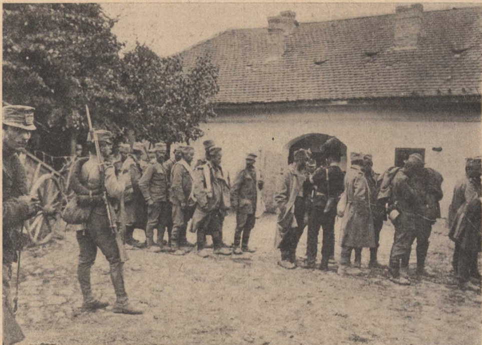
Tábori csendőrök szerb foglyokat szállítanak.

bekisérendő egyének mindig megmozdandók. Az elővezetésre az ügyészség, a bíróság és a rendőrség adhat utasítást. Az elővezetendőt nem tekintik fogolynak, hanem csak őrizetbe veszik s a hatósághoz kísérik; személyes szabadságát tehát nem korlátozzák nagyobb mértékben, mint amennyire ez okvetlenül szükséges. Nem bilincselhető meg és szökése esetén ellene fegyvert nem szabad alkalmazni. Önállóan is joga van a csendőrnek elővezetni oly egyéneket, akiknek elfogására elegendő ok nincs ugyan, akik azonban gyanus körülmények miatt a közbiztonságra nézve veszélyesnek látszanak. Az elfogás szintén felhívásra vagy önállóan történik. Elfogható az, aki ellen nyomozólevél, vagy elfogatóparancs van kiadva, aki tetten kapatik, aki nagyobb bűncselekménnyel alaposan gyanúsítva megszökött, vagy szökési előkészületeket tesz vagy elrejtőzik, aki a bűnleket elrejtí,