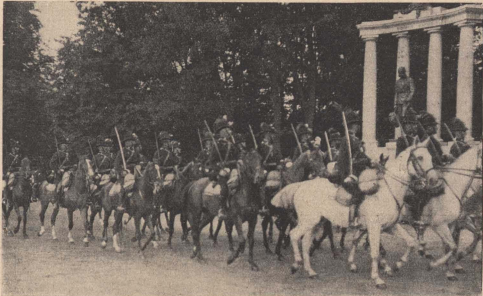
Lovas tábori csendőrszlag diszmenete.

Szilágyi Dezső is nagy beszéddel vett részt a vitában. Nem hiszi, hogy a törvényjavaslat az alkotmány bármelyik biztosítékát is megintgathatná, mert a törvényhatóságok kezébe letett rendőri hatalmat nem érinti. A cél az, hogy a fegyveres erő, mely országszerte a közbiztonsági szolgálatot végézi, ne maradjon eddigi rendszertelen, össze nem függő, fegyelmetlen állapotában, hanem olyan szervezetet nyerjen, mely föladatára nemcsak képesebbé, hanem működésében erősebbé és szabatosabbá teszi. És e tekintetben Magyarország