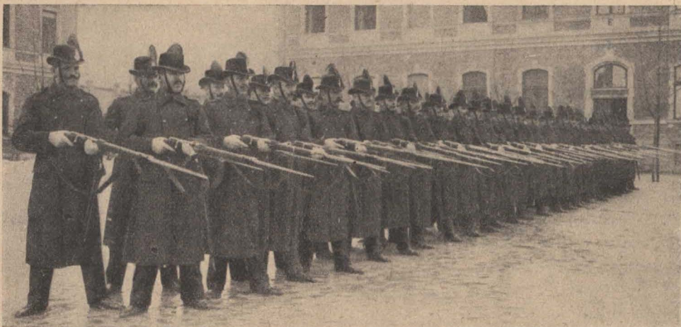
Lögyakorlatok : „Tüzelni, kész !”

oszlik. Az őrsök többnyire 4–6 főből állanak, de néhol nagyobb a létszám. Egy csendőrre átlag 27 négyzetkilométer felügyeleti terület és személy- és vagyonszolgálatot megővni, a békét és a közrendet fentartani, a büntető törvények és rendeletek megszegését, a véletlenségből vagy