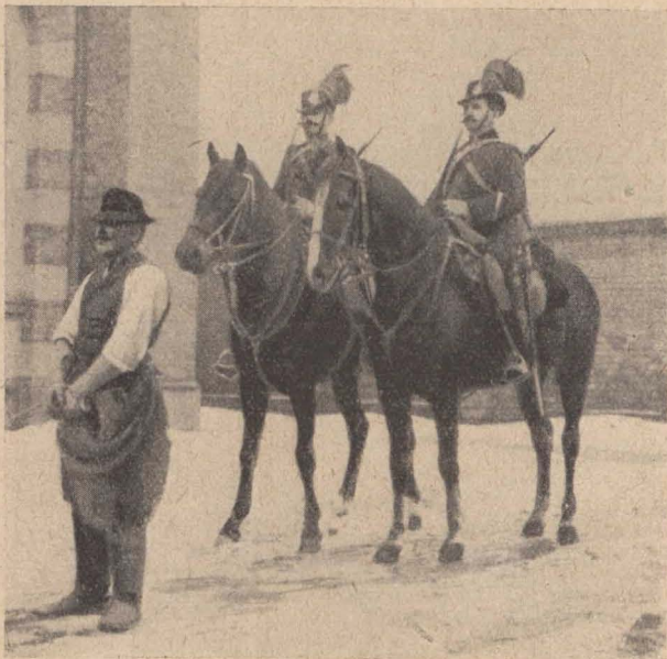
Fogylykísérő lovas járőr.

szervezéséről szóló törvényjavaslat tárgyalását. Péchy Jenő volt az előadó, aki arra mutatott, hogy a szervezendő állami Cs. a honvédelmi minisztérium és így katonai fegyelem alatt fog állni, míg a közbiztonsági teendőkre nézve továbbra is a belügyminisztérium, illetőleg a közigazgatási hatóságok intézkedése alá kerül. A kormány által beterjesztett eredeti javaslat hatálya nem terjedt ki a szabad királyi városok és a külön törvényhatósággal bíró városokra, a közigazgatási bizottság azonban az egyöntetűség kedvéért és az esetleges összeütközések elkerülése végett jónak látta azt Budapest kivételével ezekre a városokra is kiterjeszteni. Az első évben csak a szegedi (II.) kerületet szervezik meg s fokozatosan látják el az egész országot Cs.-gel. A bizottságban hangsúlyozták azt a kívánságot, hogy bűnügyekben a Cs.-el polgári törvénykezés alá helyezzék, de míg egyébként katonai szervezetben marad, e kér-