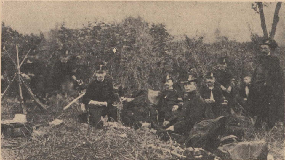
Tábori csendőrsztag pihenője. (A szerb harc téren készült fényképfelvétel.)

A Cs. szolgálatát a fennálló utasítások, törvények, rendeletek és saját előjárói parancsai szerint önállóan teljesíti. A közbiztonsági hatóságok, kir. bíróságok, ügyészségek, országos