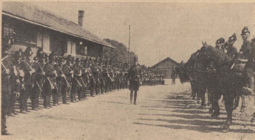
Lovas és gyalogos tábori csendőrök indulása a szerb harctérre.