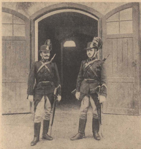
Gyalogszolgálatot teljesítő lovas csendőr-járőr.