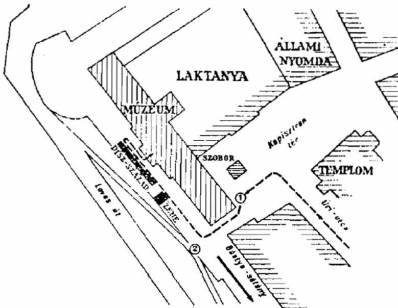
A csendőrhősök domborművének leleplezési színhelye.