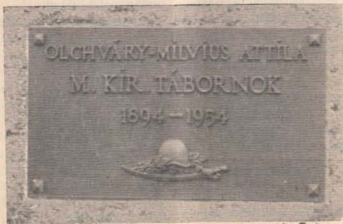
Olchváry-Milvius Attila vezérőrnagy síremléke a montreali temetőben

A Bajtársi Levél jelen száma 4 havi összevont szám a szerkesztő-kiadó nyári szabadsága miatt.