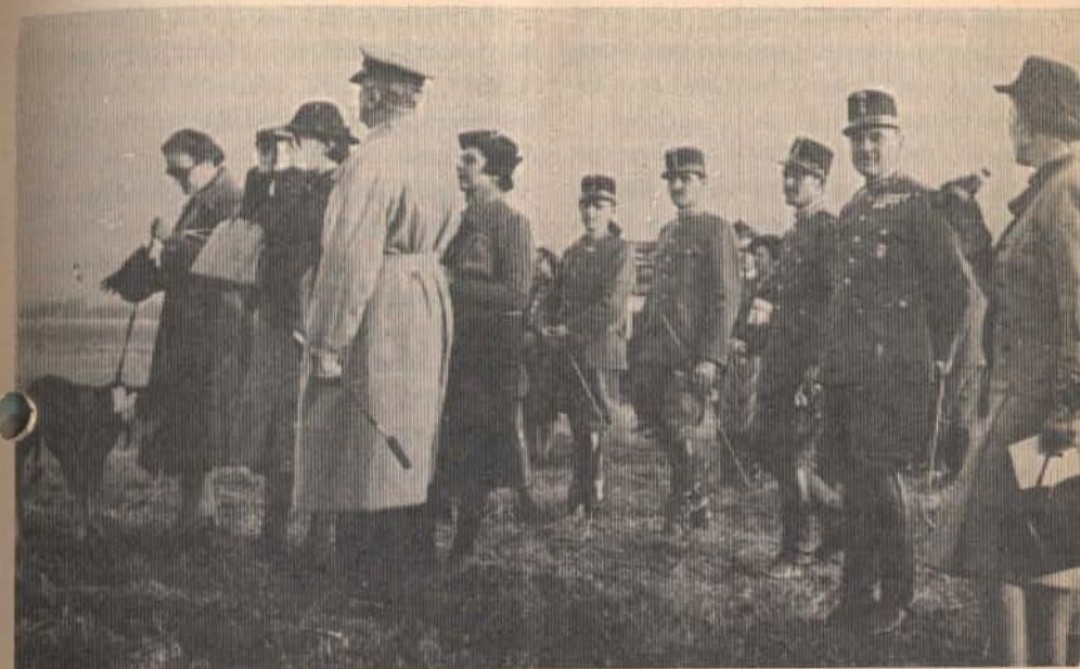
Horthy Miklós kormányzó falkavadászaton, mögötte a helyi szárnyparancsnok