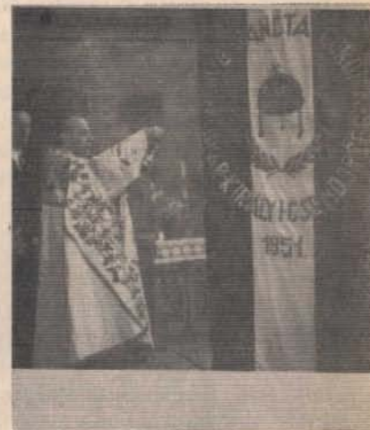
Az első emigráns csendőrzászló avatása 1951-ben Salzburgban.

A beérkezett tudósítások szerint tehát csendőr emigrációknak kerületi, osztály, szárny és őrsparancsnoksági zászlókkal rendelkeznek az idekint készült zászlókon kívül.