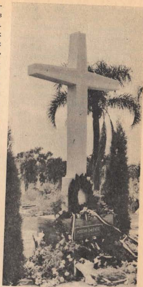
A Sydneyi (N. S. W.) Ausztrália Szabadságharcos és hősi emlékmű. A bronztábla felett a MKCSBK koszorúja látható.

Igy estünk fogságba sebesülésünkben a gyűlöletben. A szovjet katonák mindegyünket elszedték és csak a rajtunk lévő