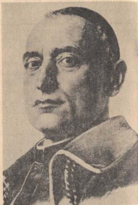
Tisztelgünk Magyarországon ELSŐ ZASZLÓS URAT: Mindszenty József bíboros hercegprímás élő mártíromsága előtt!

A buenos airesi nagyszerű ünnepséget Nagyiványi Ödön szds bajtársunk rendezte és ő töltötte be a bemondó sze-