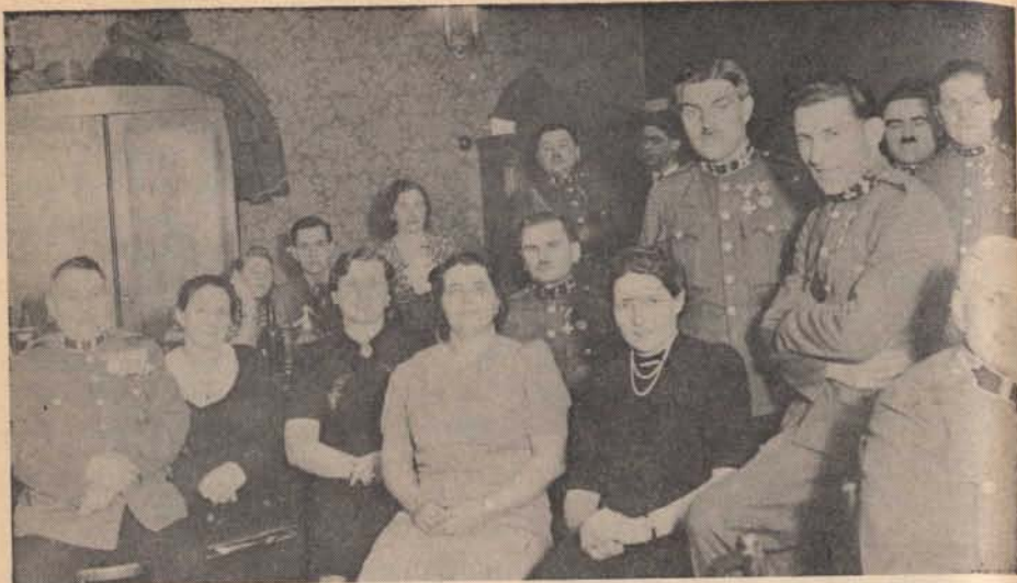
Csendőr tiszthelyettesi bál 1942-ben Budapesten 200 résztvevővel, hol a csendőrség felügyelője is megjelent.