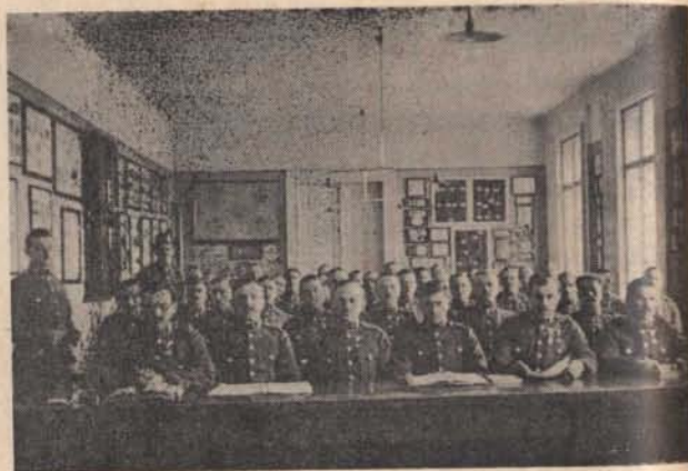
Egy járőrvezetői tanfolyam az iskolapadban.