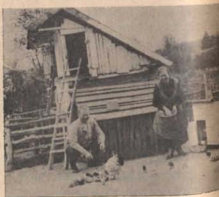
„Létszámszaporodás” a cserhátsurányi őrsön 1937-ben

A kanadai magyarság, köztük többszáz csendőr bajtársunk, méltóan kiveszi részét a színes, lélekemelő ünnepségekből!