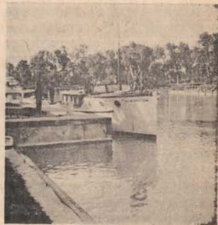
„Gr. Klébelsberg Kuno” csendőrhajó a Balatonon.

Az első vízcsendőr őrs (nem fürdőkülönítmény) 1942. június 1-én kezdte meg a szolgálatot, mint