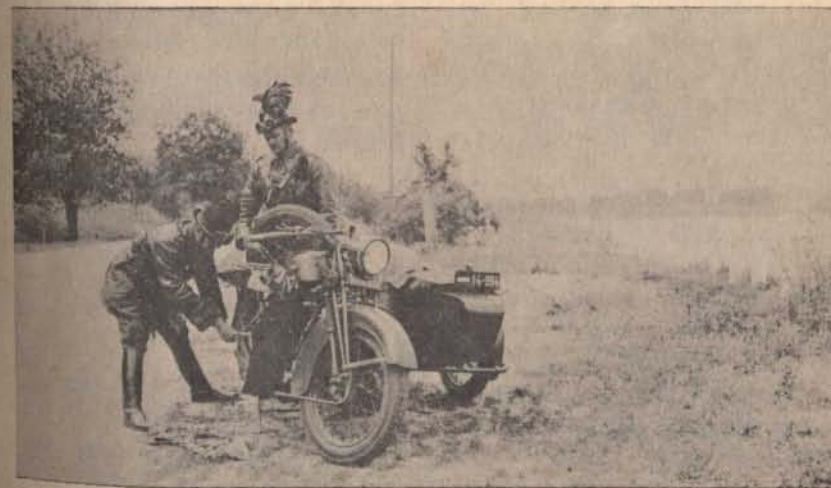
Vigyázat, lassan hajts! Közlekedési járőr az 1930-as években a magyar országúton.

Bajtársak, kérünk, küldjétek be továbbra is a veszteségeink rovatába szánt adataitokat, hogy ezzel is alátámaszthassuk azt a tényt, miszerint a m. kir. Csendőrség a haza válságos idejében a közbiztonság fenntartásáért és az ország védelméért — követve az ország kormányának rendelkezéseit — a bolsevizmus és a hazánkra törő ellenséggel szemben feláldozta önmagát!