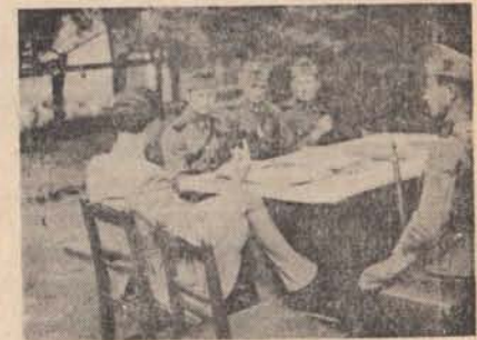
Szárnyparancsnoki oktatás a nagykarolyi örsön 1943-ban.