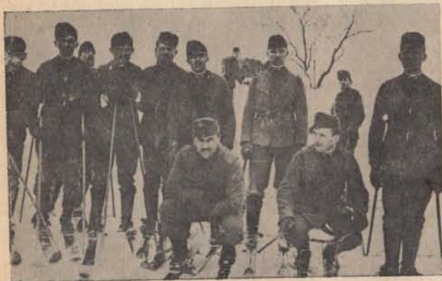
Sítanfolyam a Kárpátokban a hegyi őrséink számára.