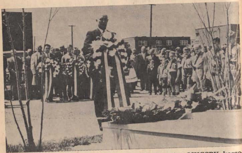
A MKCSBK egyik központi tisztségviselője leteszi a MKCSBK koszorúját a montreáli Magyar Hősök emlékkövére a cserkészek sorfala közt és az ünneplő magyarság előtt.

védekezhetem pisztollyal. Mi ezt tettük. Legyünk okosabbak a jövőben. Ha banditákkal állunk szemben, húzzuk le a glaciékesztyűt, gyűrjük fel ingujjunkt és tegyük félre a lovagiasságot, mert azzal már nem megyünk messzire. Az idők változtak. Régente, ha egy külföldi követet megölték (pl. báró Kettlert ez évszázad elején Kínában) abból háború lett és a büntető hadjárathoz más államok is csatlakoztak, ma minden veszély nélkül államelnököket ölnek le, telt tisztikaszinókat robbantanak fel tábornokostól együtt, egymás arcába köpnek, letörlik és továbbkártyáznak. Ilyenektől függ a mi jövőnk.