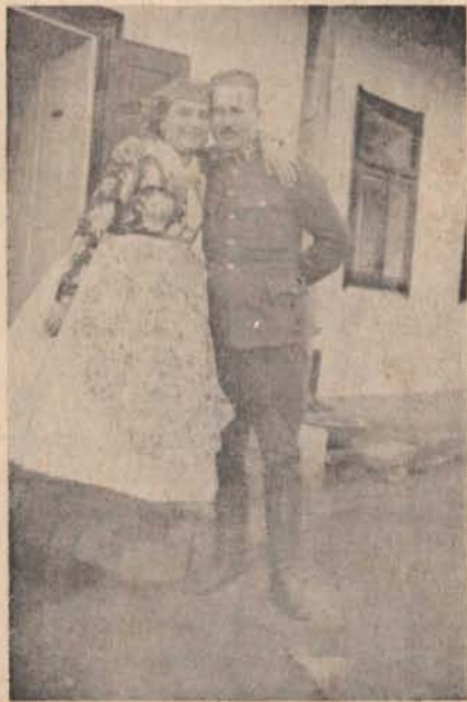
„Palóc menyecske” a cserhátsurányi őrsparancsnok felesége.