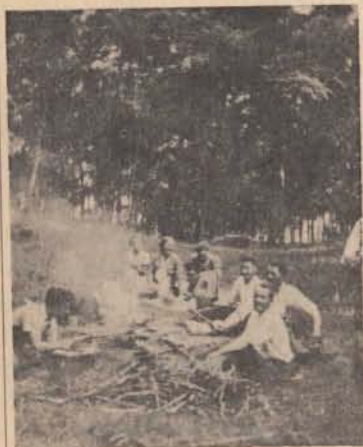
A cserhátsurányi őrs „pikniken” 1937-ben.

Köszönjük Bajtársak! A vezetőség tiszteleg!