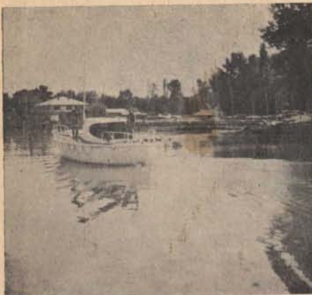
A „Csendőr I.” hajó bevonul balatoni szolgálatból az örskörletébe.

olyan, egyelőre a Balatoni Hajózási R. T.-től bérelt két motoroshajón. Az örslaktanya Siófokon, az Andrassy úton volt. Hátsó kapuja a Sió csatorna rakpartjára nyílt, mely rakpartnak a közvetlen kapuelőtti része a viziörs hajóinak kikötésére is szolgált.