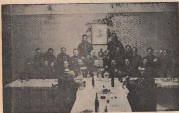
Csendőrnapi az ózdi őrsön 1939-ben.