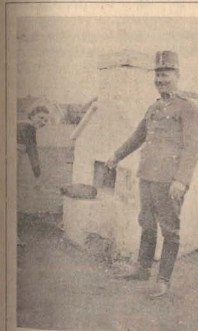
Az őrsparancsnok felesége süti az áldott magyar kenyeret a cserhátsurányi őrön 1937-ben.

deket a lankás-dombos ohioi tájkon. Jól ismeri az utat, mint egy régi kiszolgált csendőrló a portyázási területét, hisz elég gyakran tettem meg. Szép színes októberi táj ragyog az őszi korai reggeli napsütésben. No már nem is vagyok messze. A 322-es útkereszteződésén átjutottam s egy pár perc múlva már nem beton úton fut a kocsim. Már látom is a jól ismert házat az út baloldalán. — Lassítok. A fehér kavicsos kociúton fordulok be. Jobbról fenyőfák adják a szegélyt, balról pedig a még min-