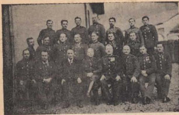
Egy nagylétszámú gyalogőrs a csendőrnapon.