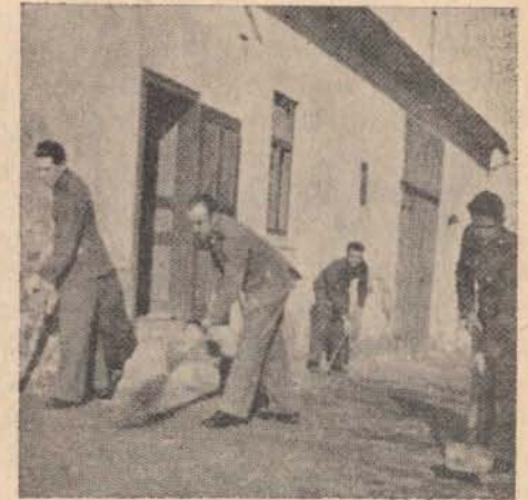
Körlettakarítás az őrön.