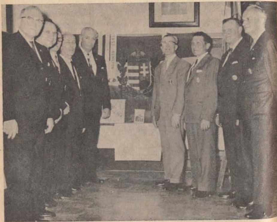
A Szent László Társaság oklevelével és jelvényével kitüntetett montreáli csendőr bajtársaink.