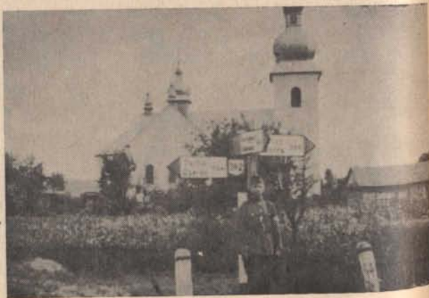
Tábori csendőr egy útelágazásnál Kárpátalján 1939-ben.

lönbséggel indultunk. Gyülekező helynek a fenyőerdő keleti részénél levő sósvízkutat jelöltük ki. Annál a sósvízkutnál félórai pihenő, s közben terepszemrevételezés stb. Nagyobb haditerv megbeszélésére nem volt idő, mert E. őrmester azt javasolta, hogyha valaki medvét lát, nehogy rá lőjön, mert akkor valamennyiünknek vége. Medvét engedjék át öneki, majd ő végez vele úgy, hogy senkinek sem lesz belőle baja.