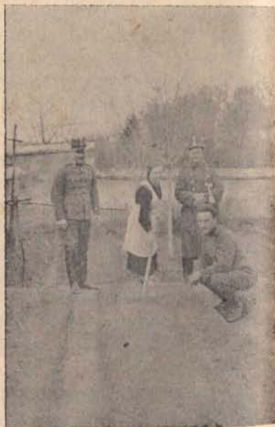
Közigazgatási tevékenység 1937-ben a cserhátsurányi őrsön.