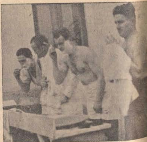
Ebresztő után az őrsön.