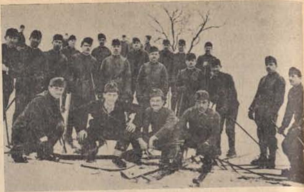
Sítanfolyam a Kárpátokban a hegyi őrséink számára.