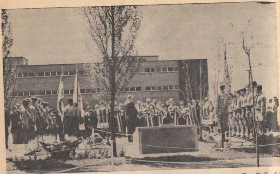
Magyar Hősök napja Montreálban 1967. május 28-án a gyönyörű és modern magyar római katolikus templom kertjében.