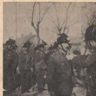
Egy csendőr főhadnagy kitüntetése Gödöllőn az ellenség előtt tanúsított vitéz és bátor magatartásáért Signum Laudisszal 1944-ben