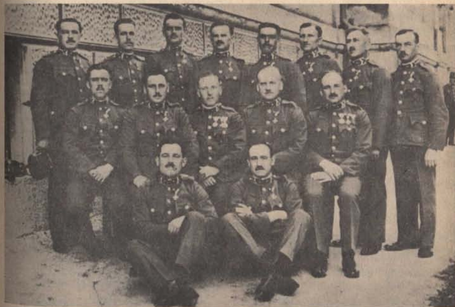
Orsparancsnokképzős iskolatársak 1938-ban Szombathelyen

4.) — Az egyik közeli városban fekvő áruházból telefonáltak, hozzak haza egy nőt, aki hirtelen rosszul lett. Ott is voltam rövidesen, s nővére segítségével beültettük a hátsó ülésre. Mellette a nővére foglalt helyet. Útközben a beteg nem kapott levegőt, fuldokolni kezdett. Erre izgalmamban hátra-kiabáltam, gombolja ki gyorsan a