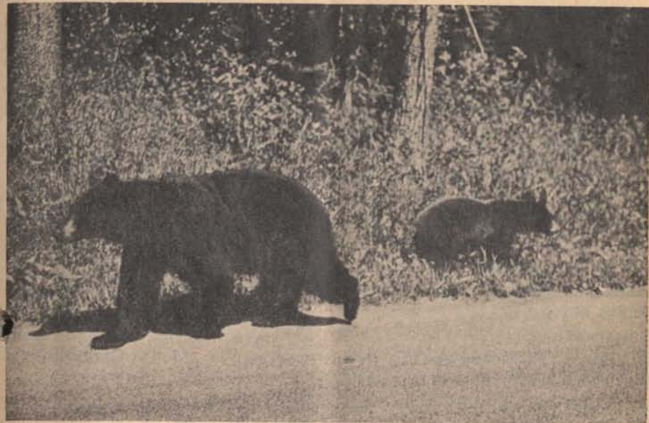
A kanadai medve.

a szörnyű időben aludtak a vadak, még nyuszi nyomot se láttunk a hóban. Bagó így is szerencsés volt, a patakmederben talált egy 3 éves özaggancsot!