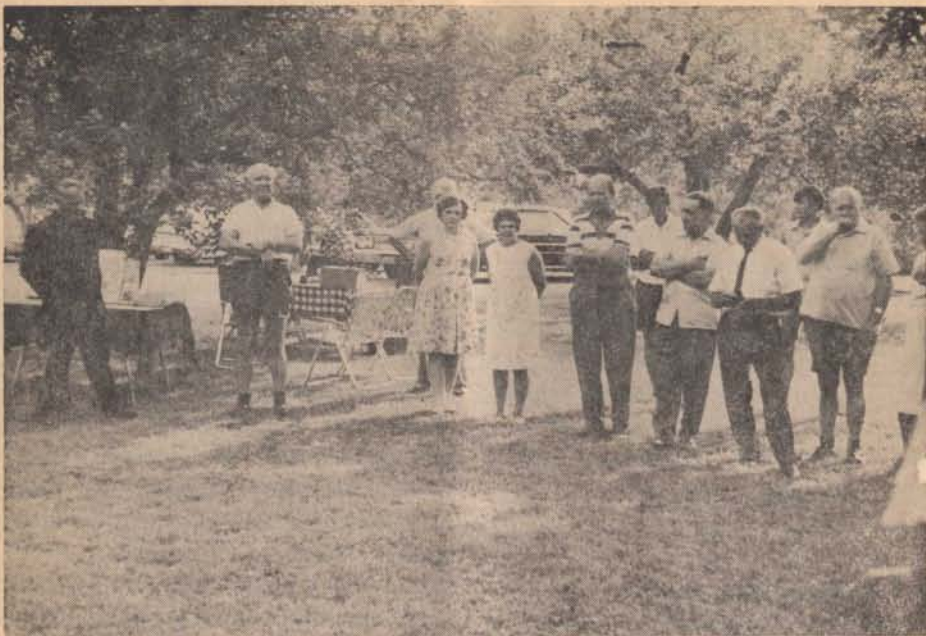
Niagaravidéki csendőr piknik 1969. július 20-án.

lehet. Tiszteletére itt is mozgásba jöttek a butykosok. Majd az ügyvezető elnök tartott ismertetést az egybegyűlteknek a MKCSBK világszervezetének jelen helyzetéről.