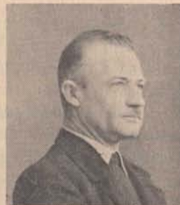
Sifter Mihály szakv.

vitéz Fábry György alezredes 74 éves korában 1969. novemberében hosszú betegség után Villach-ban, Ausztriában elhunyt. A Bajtársi Levél és a központi segélyalapunk karácsonyi küldeménye visszaérkezett a „gestorben” megjelöléssel. Haláláról a Vitézi Rend és bajtársai értesítettek.