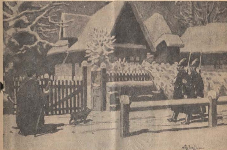
Csendőrijárőr a magyar télben.

Közben az őrnagy úr beszélt. Most se emlegette a kilőtt szarvasbikákat és az őzbakokat! Elvonultak előttünk az életben maradt vadak. Puskagolyó vérgőzétől mentes szarvasbögések, az erdő mélyén élő nagyvadak... Járőrtársammal éreztük, hogy egy nagy vadász mesél: