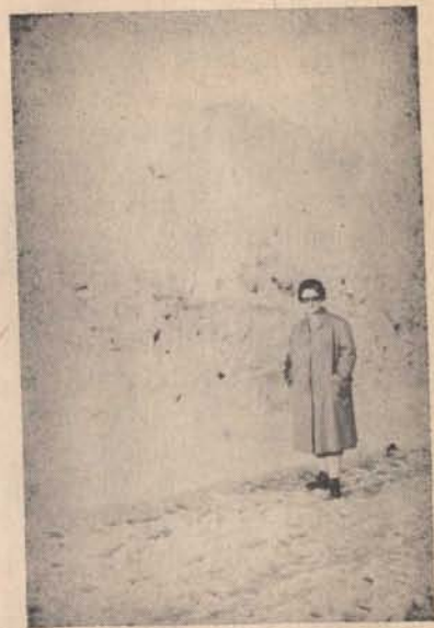
Öt méteres hótakaró Észak-Kanadában.

Csendőr Bajtárs, beszerezted már vadászpuskádat és felszerelésedet? Van fogalmad, mily szép ott messzi északon az elhagyatott erdőben? Csatlakozoi öszre csendőrvadász bajtársaidhoz? A vadászat ősi magyar sport, a fegyver viselése otthon hivatásunkhoz tartozott! Mire vársz? Arra, hogy elrohanjon feletted az idő? A kanadai észak az élmények sorozatát, Isten szabad természetének szépségeit adja Neked! Csatlakozz a vadászcsoporthoz! Bajtársak mindenütt, ahol csökök élnek, szervezzetek vadászcsoportokat!