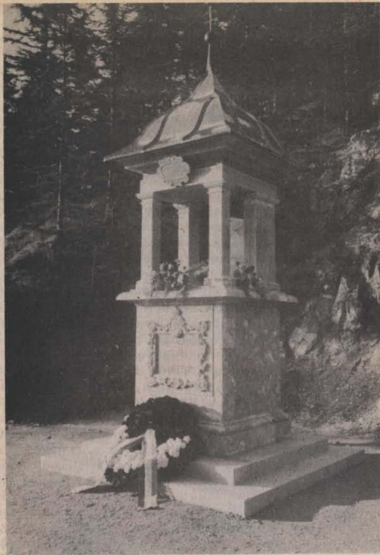
A keresztút A X., a Mártír Magyarok stációja.

tanárok, írók, diákok, diáklányok szólaltatták meg nemzeti és irodalmi nagyjainkat és felolvasták Mindszenty hercegprímás imáját, melyet 1947.II.10-én mondott el a Bazilikában a párisi "békekötés" aláírásának órájában. Az ünnepély éjjel tájban ért véget.