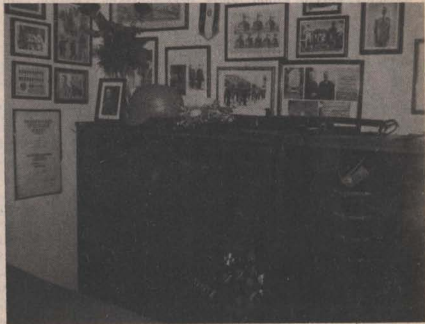
A kibővített Múzeum új ereklyéivel 1977 nyarán.

Az 1977. év folyamán, augusztus 31-ével bezárólag az alábbi újabb emlékek és adományok érkeztek be, melyeket a leltárba való bevezetés után ezúton is köszönettel nyugtáz a Múzeumőr: