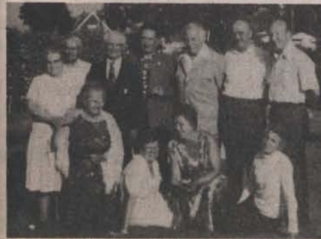
A vendéglátó victorai bajtársak, feleségeik és vendégeik.