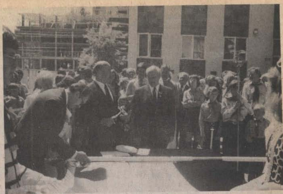
Az MKCsBK küldöttsége az ünnepélyen