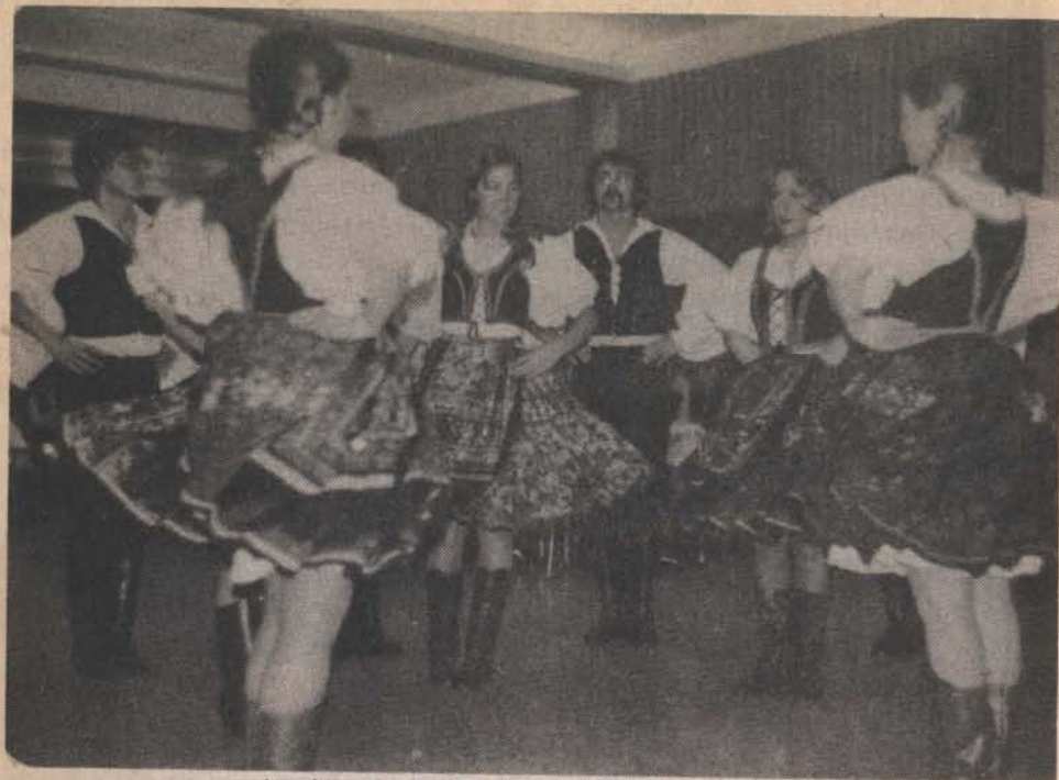
A calgaryi MHBK „Vadrózsa” táncsoportja.