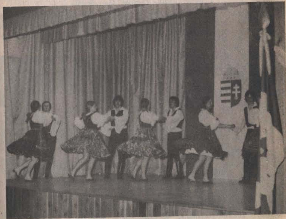
A calgari MHBK „Vadrózsa” táncsoportja.