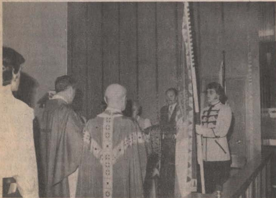
A zászló és a zászlószalag megáldása.