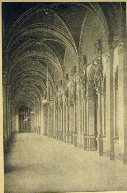
A főrendiház folyosójának budai oldala.