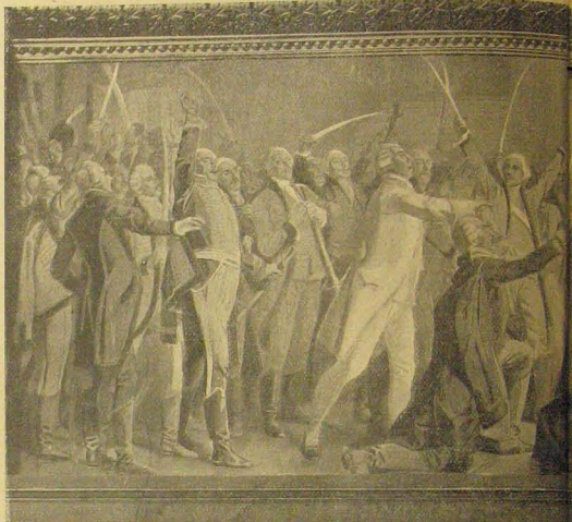
Mária Terézia a p

A választási elnök reggel nyolcz óraker nyitja meg a választási eljárást a kerület székhelyén. Ettől számított fél óráig lehet jelöltet állítani, oly módon, hogy a kerület