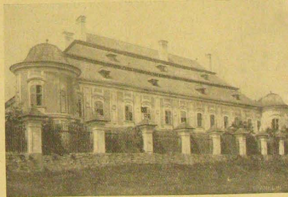
A zborói kastély.

A Rákóczi-családnak kedves birtoka volt Zboró és fényes napokat látott. Különösen I. Rákóczi Ferencz