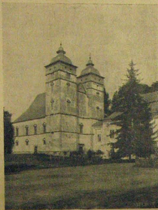
A zborói templom.

a hol a véres eset történt, kiosonni. Az illető szinte futólépésben sietett tovább s az első mellék-utca sarkán eltűnt. Megvan tehát a valószínű gyilkos személy-leírása.