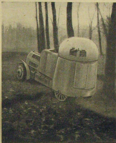
A francia kormány számára készült hadi automobil elülről és hátról nézve.

sok megközelítőleg sem tartják megfejthetőnek; legfőlebb a föld és a naprendszer keletkezésének idejét próbálgatják némileg megközelítőleg számokban is kifejezni.