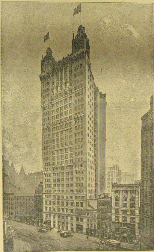
A legmagasabb ház. A Park Row-épület Newyorkban.

New-Yorkban és Chicagóban főképp a telkek mesés árai miatt nagyon megszorodtak a tíz és több emeletes épületek, melyeket az amerikai néphumor ma már általában «Skyscraper» (felhő horzsoló) névvel illet. A legmagasabb házirás nemrég készült el New-Yorkban. Ez a képvünkön is látható Park Row nevű épület, mely három homlokzatával a hasonló névű térre meg az Ann-