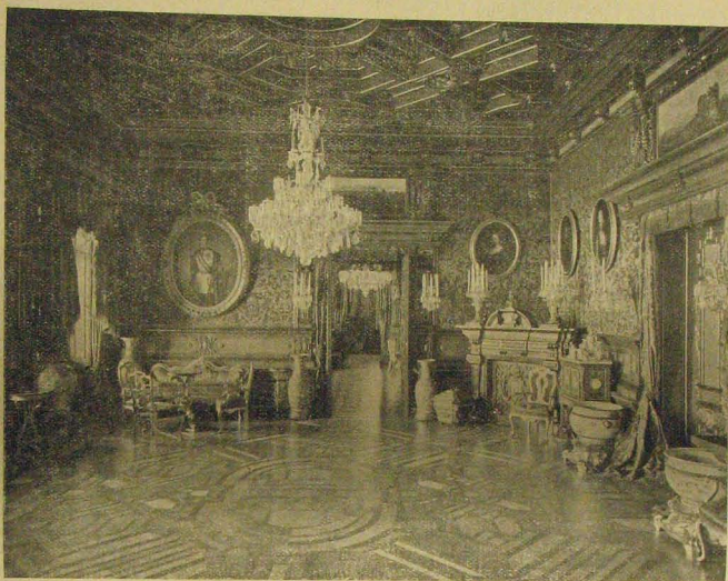
Fogadó terem a miramarei kastélyban.

a tettes lányomának úgy az ablakpárkányon, mint az asztalon feltétlenül vissza kellett maradnia.