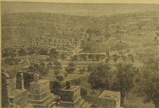
Az olajfák hegye.

dollára rugó költség megszavazását a népre bizták és miután ezt az első ülésen végérvényesen el is határozták, az egész nagyszabású munka megkezdésének semmi sem állotta útját.