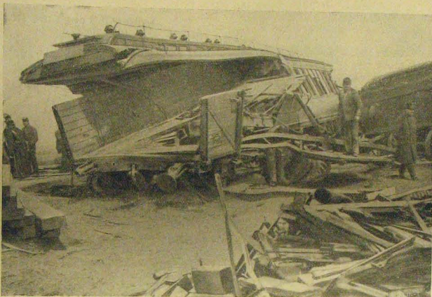
Az egymásba szaladt hálókocsi és teherkocsi.

nyert. V. L. őrsvezető. A huzási lajstrom itt nem kapható. Forduljon e végett közvetlenül az illető egyesülethez, vagy oda, ahol a sorsjegyet vette. T. Érdeklődő, Őrsparancsnok Bolya, J. járásörmester Medgyes. Öreg zsandár, T. J.