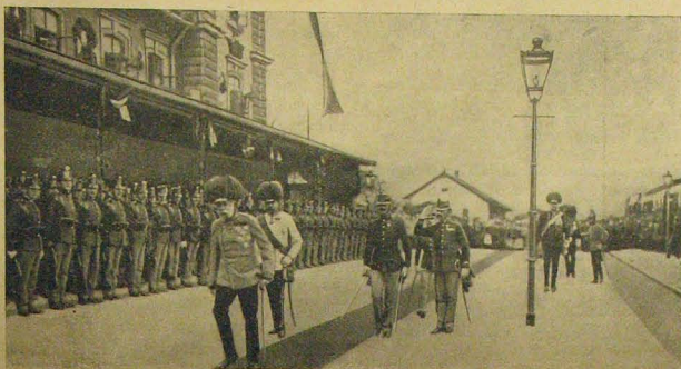
A király ellépet a diszszázad előtt.