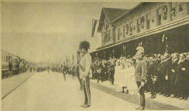
A király elindul Benesovból. (Az előtérben Ferenc Ferdinánd trónörökös).

sára. Volt azonban egy óra, a ki igen intelligens ember s addigaddig figyelgette a bús állatot, míg ki nem puhalt a baj okát. Az elefánt egyik lábára sántított. Elővett egy hatalmas kését, s behasított a vastag szaruhártyába, a mely az elefántok lábát fogságukban szokta bevonni. Az állat hűséges szemeivel követte operateurje mozdulatát. De egyszerre eleven húst érintett a kés. Orrmányával felkapta órét s a ketrecz sarkába vitte. De felemelte lábát s hagyta szépen lassan megmozdítani a hosszú szőget, a mely már jó mélyen beleete magát húsába. Aztán odakapott orrmányával s szépen kihuzta ő maga. Órét vigyázva felemelte s szépen kivitte ketreczéből.