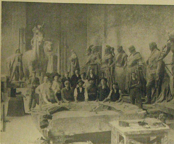
Az ezredévi emlék szobrai az ercztöntődben

el kell rejtőzködni, hogy a kutya meg se láthassa. Ezzel megfelleltünk a feltett kérdésre és csak ismételjük, hogy büntettek nyomozásánál első feltétel, hogy a kutyát a helyes nyomra vezessük. A kutya aztán az egyszer megszaglászott nyomon a legtöbb esetben el is vezet bennünket a tetteshez. Sőt ha a tettes közben kocsin menekült, a kutya akkor is követni fogja a nyomot, ha csak ez a nyom túlélénk közlekedés folytán teljesen meg nem semmisítettett.