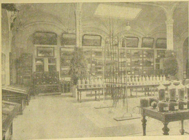
Állami ménesbirtokok és a gödöllői korona-uradalom.