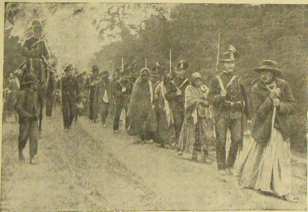
Útban a Szarvas-csárdához.