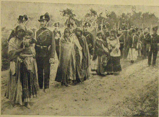
Czigányasszonyok csendőr kísérettel.