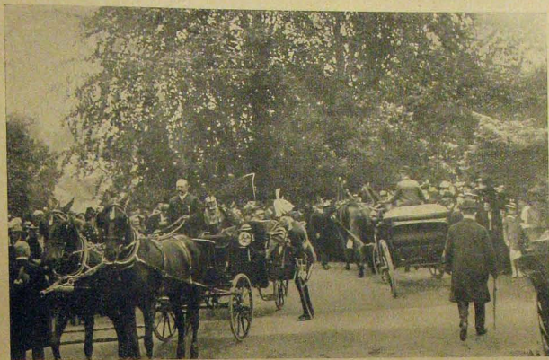
VII. Edvárd király Marienbadban a királyunk születése napján rendezett istentiszteletre érkezik.