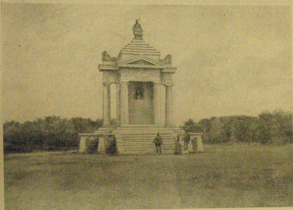
A milleniumi emlékmű.

tartalmulag közölte is van — a hivatalosjelző állásokra jogosító igazolványaik alapján már ily állásban alkalmazva volt állítottak, a szolgávé történt kinevezetésük után megszerzett qualificatio alapján hivatalnok állásra leendő kinevezésre igényvel nem bírnak.