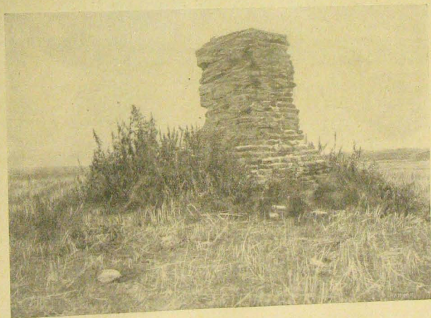
Szer község kápolnájának romjai.