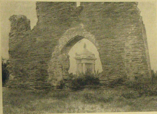
A millenniumi emlékmű a templom-romon át nézve.