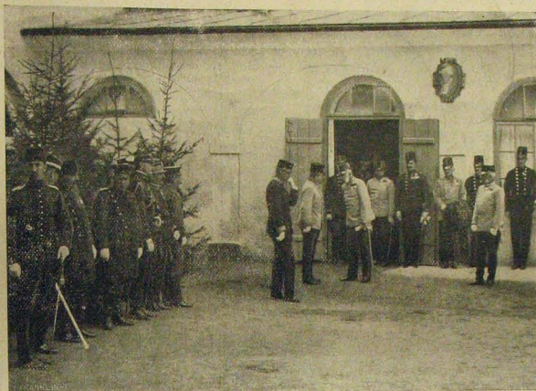
A király étkezésre menőben megszólítással tünteti ki a jelenlevőket. (Balról az idegen államok katonai képviselői.)