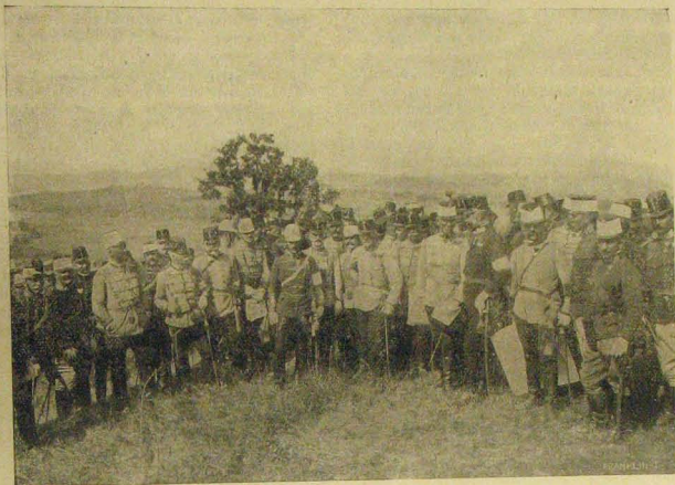
József főherceg a hadvezetőséggel.