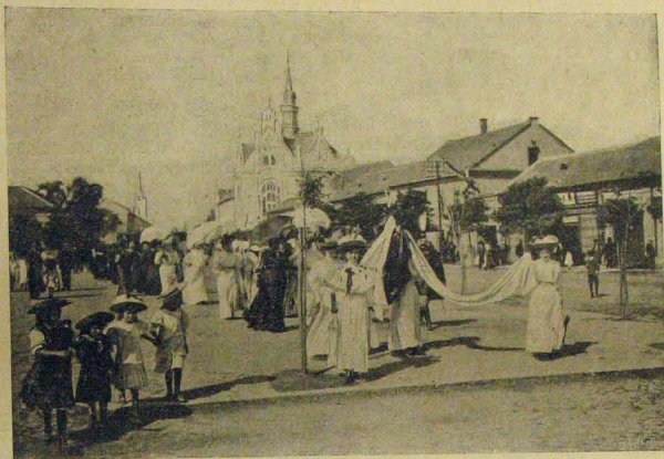
A szalontai hölgyek koszorúját viszik Arany János szobrához.