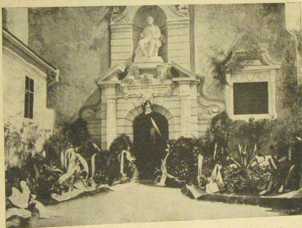
A nagyszalontai esonka-torony bejárata az Arany-szobor leleplezése után.