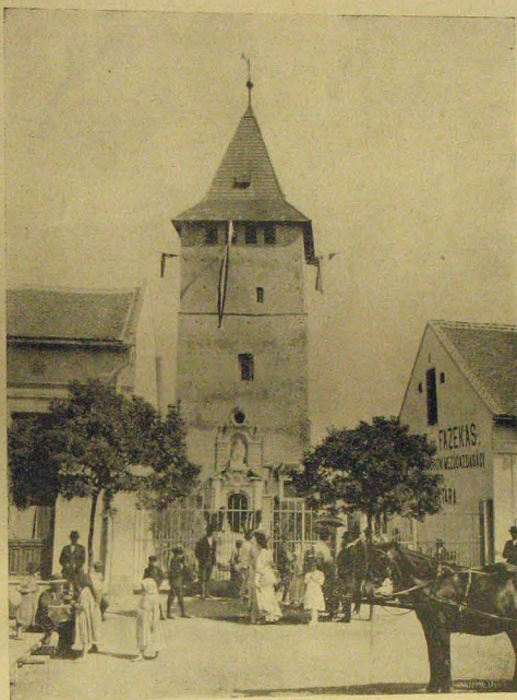
A nagyszalontai csonka-torony átalakítva az Arany-émlékkel.

Julius 2-án éjjel 11 óra tájban Parázso azzal riasztotta fel álmából, hogy jöjjön azonnal az istállóba, mert fivére agyonlőtte magát. Azonnal az istállóba rohant, hol fivérét élettelenül az ágyon fekvé találta. Jobb arcából patakzott a vér, nyakán pedig égést a fojtástól meggyuladt ing. A tüzet azonnal elfojtotta és kezdte fivérét élesztgetni, de fáradozása hiábavaló volt, fivére nem adott többé életjelt magáról. A fegyver ott feküdt az ágy mellett a földön, mellette egy zsineg, melynek mindkét végén hurokszerű csomó volt alkalmazva. A fegyver csöve még meleg volt.