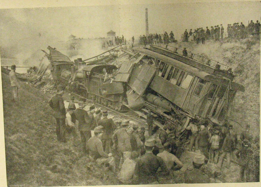
A két összejártó vonat roncsai Budapest-kitérőnél. Vasuti szerencsétlenség a főváros mellett.