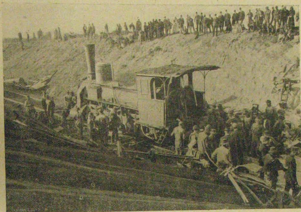
A tehervonat mozdonya.