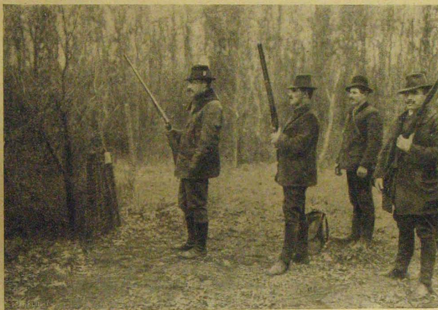
József főherceg lövő-állásban.