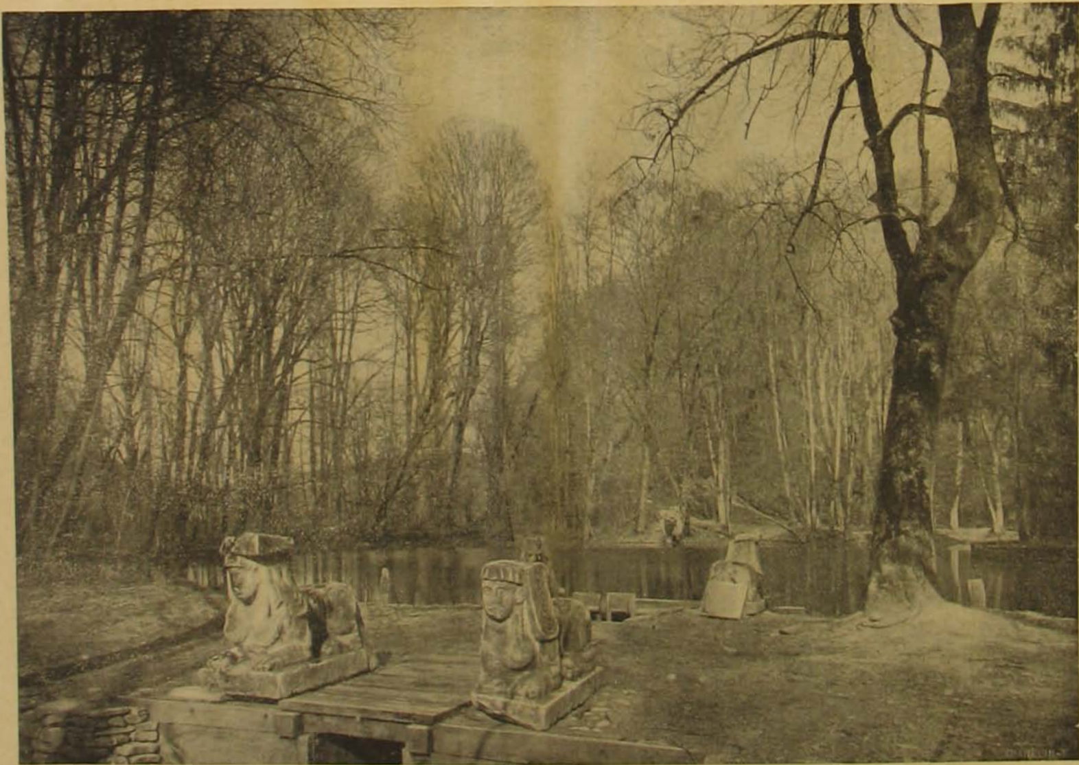
A görögny-szentimrei erdőéri szakiskola (Rudolf trónörökös egykori kastélya) botanikus kertjével.