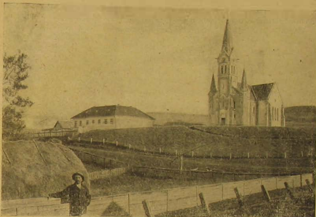
Uj otthonok. — A nagysármási református templom és paplak.