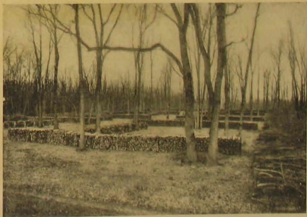
Rendszeres fatormolás a vadászgerdői erdőéri szakiskolában.