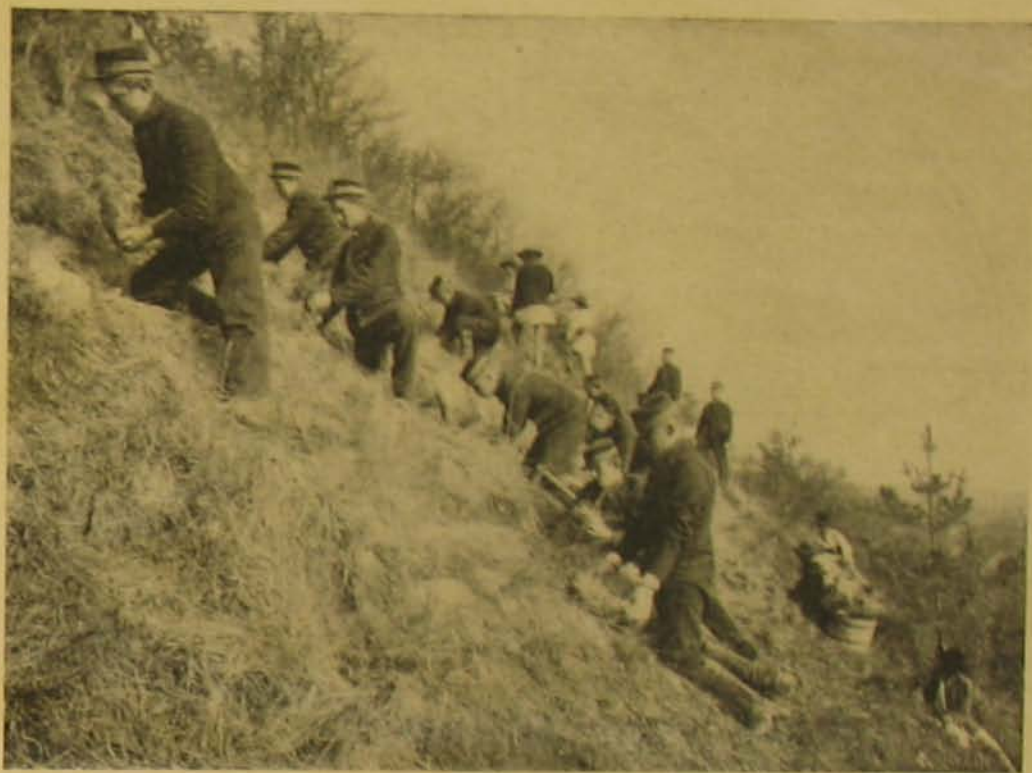
A görgény szentimrei erdőéri szakiskola növendékeinek faültetési gyakorlata.