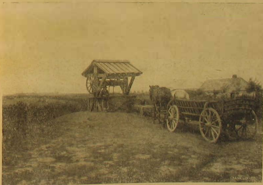
Uj otthonok. — Teloposok szántóföldje és közös kútja Facseten.