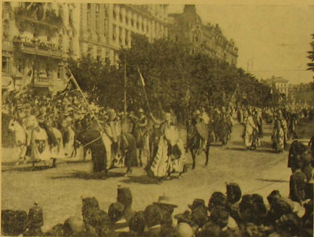
Habsburgi Rudolf felvonulása.