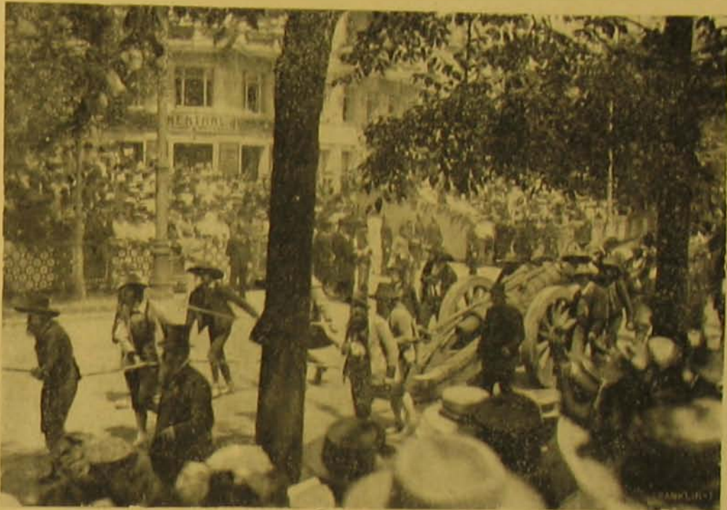
Tiroli népi öklés.