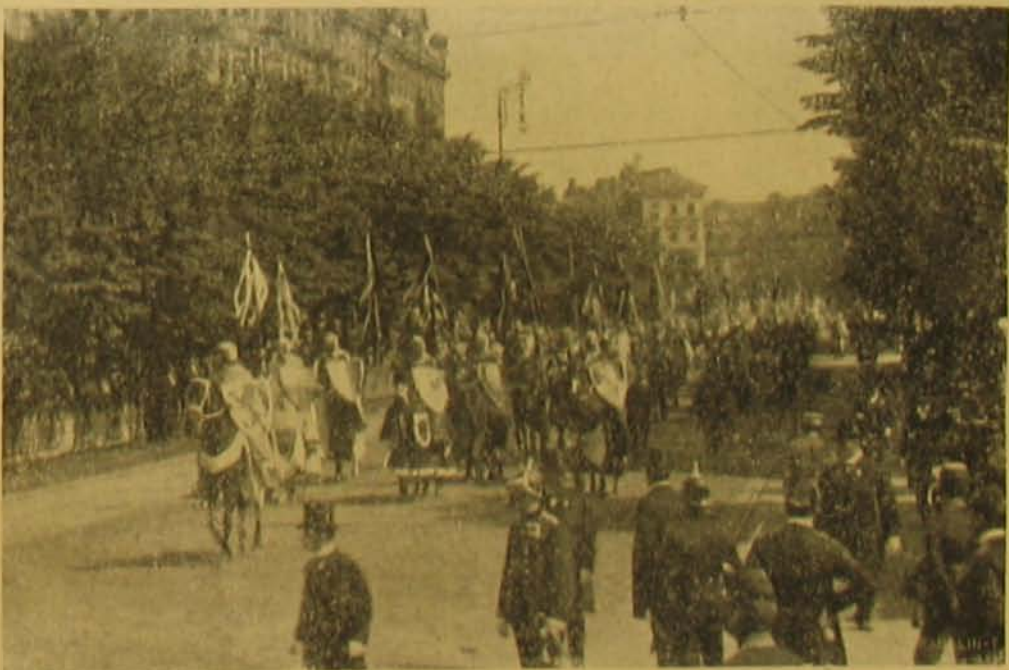
Felvonulás lovagi tornán III. Frigyes idejéből.