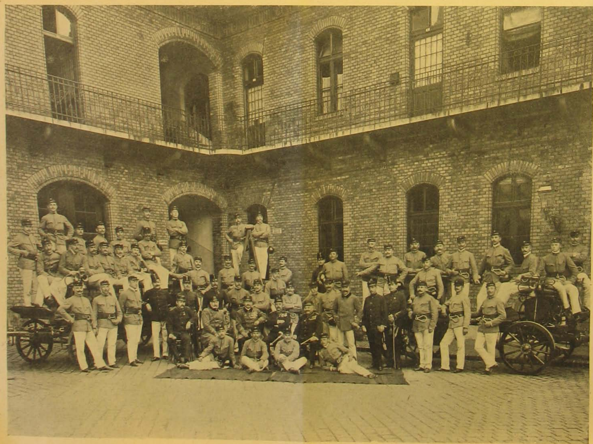
A XVII. országos tűzoltó-szaktanfolyam hallgatói.