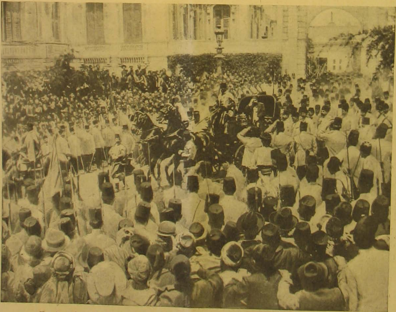
Konstantinápolyi képek. — A szultán visszatérése a szelamlíkról, melyen először jött szabad öt löfőnyképezni.