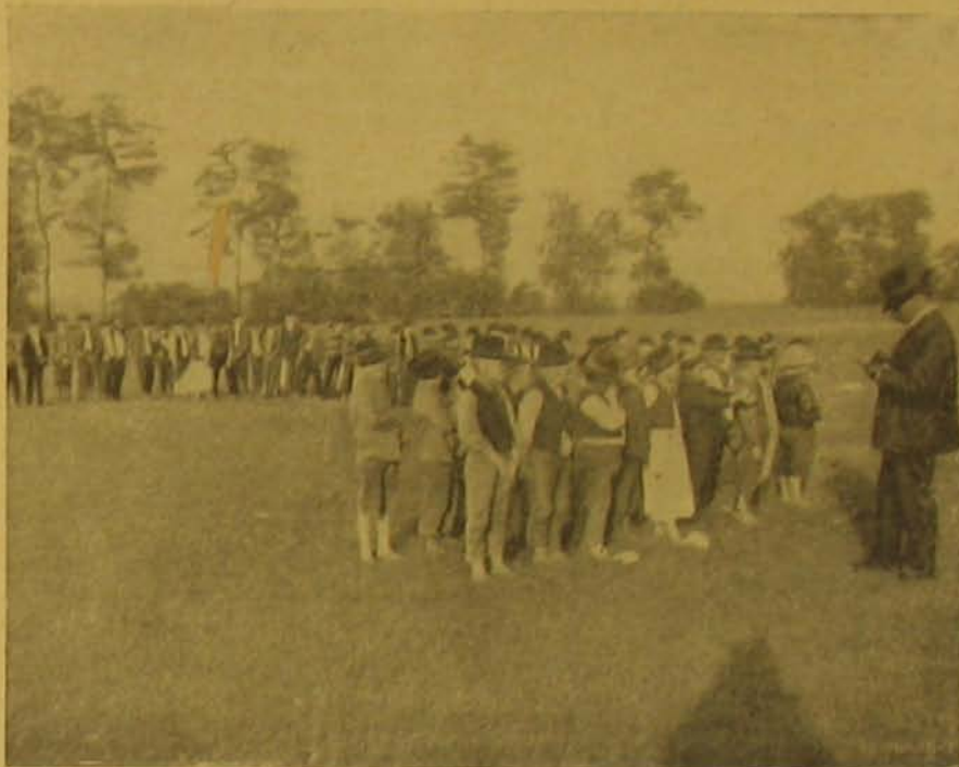
A némezi falanx monori népversenyről. — A mezítálas század.

Éppen a déli fejestől jött Őrsze néni, kezében a telt sajtárral, midőn a esendőrök kapuajtót nyitottak. A siatergő mennykő nem ijesztette volna meg jobban ökegyelmét, mint a két szuronyos vitéz; ma délután nem telik majd uzsonnára, a tej szótönilt az ambituson.