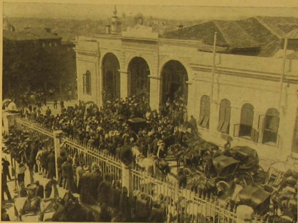
Konstantinápolyi képek. — A nagyvezér megérkezése a magas portára.

A 30. §. szerint: «azon tisztviselő, altiszt, vagy szolga, a ki a szolgálat teljesítése közben, vagy a szolgálat teljesítése következtében lett teljesen és nyilván bebizonyíthatólag szolgálatképtelenné, a minisztortanács határozatával kivételesen nagyobb nyugdíjban részesíthető, mint a mennyi neki szabályszerűleg jár; azon esetben pedig, ha 10 évi szolgálattal nem bír, hasonló módon részesítendő nyugdíjban, ez azonban legutóbb élvezett beszámítható fizetésének felét meg nem baladhatja. Ily kivételes körülmények közt az ideiglenesen, vagy kor- engedély mellett alkalmazottak is ezen nyugdíjban részesítendők.»