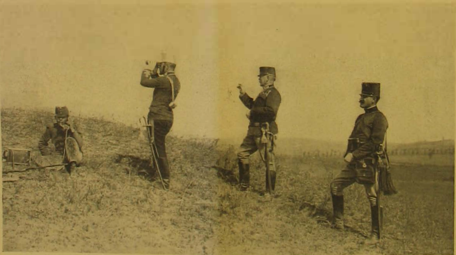
József főherceg a gyakorlaton.

A budapesti honvéd-gyalogezred géppuskás osztagjának gyakorlatai Gödöllő környékén.