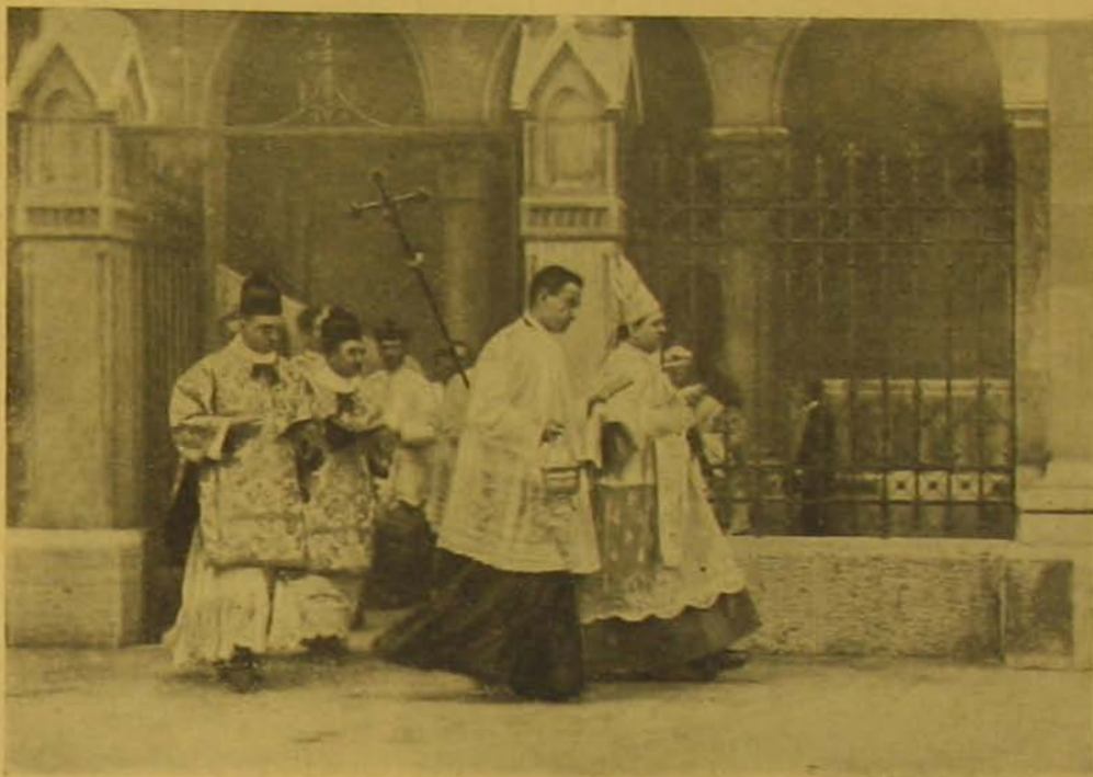
Kohl Medard püspök kíséretével körüljárja a templomot.