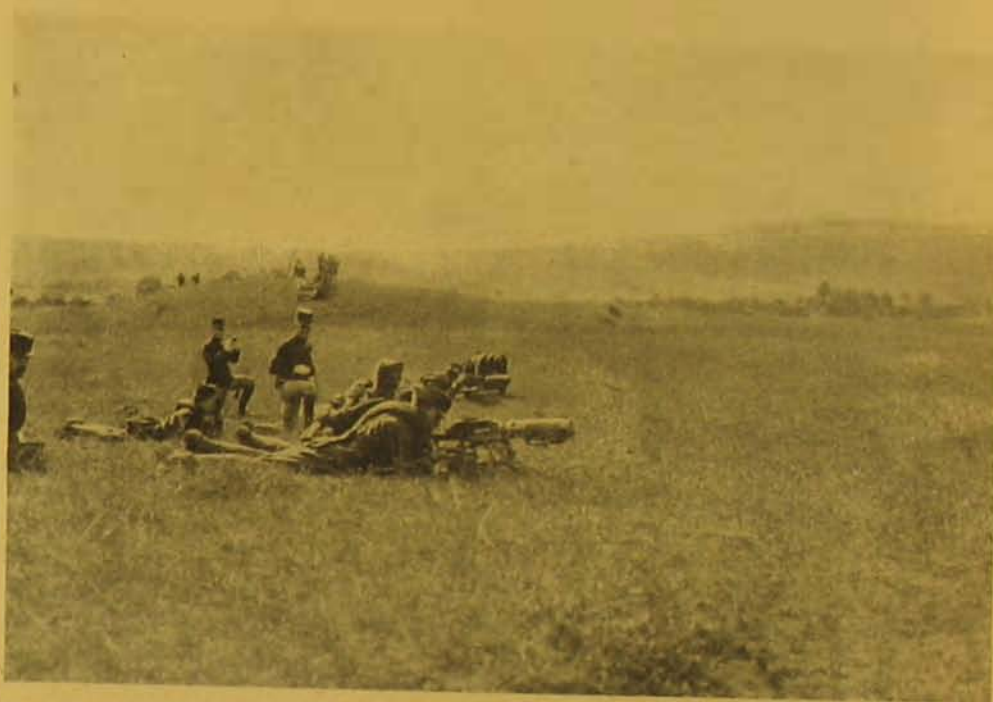
A géppuskás osztag tüzelésre készen.