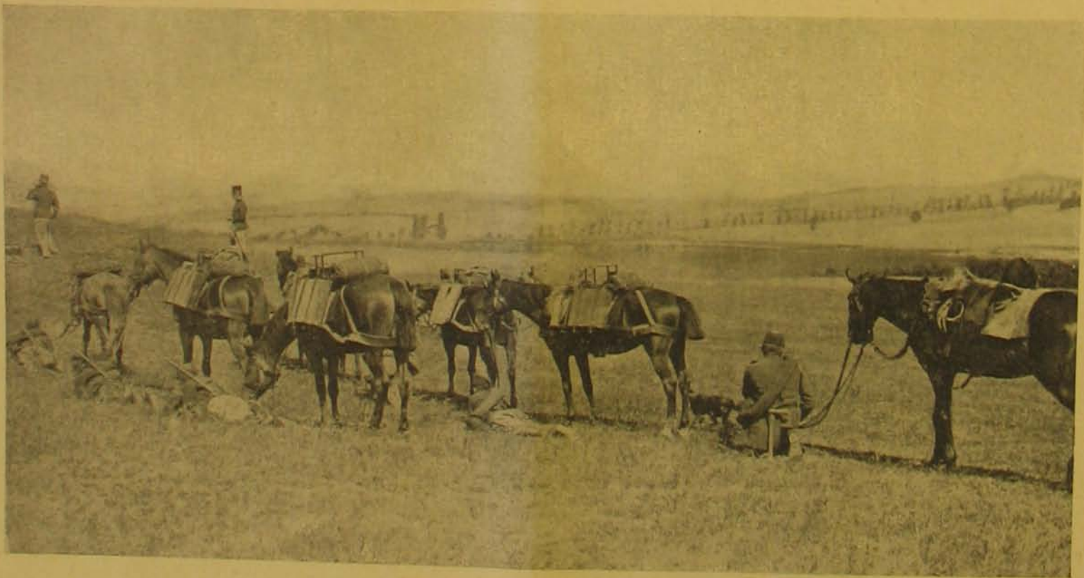
A géppuskás osztag málhás állatai fedezék mögött.