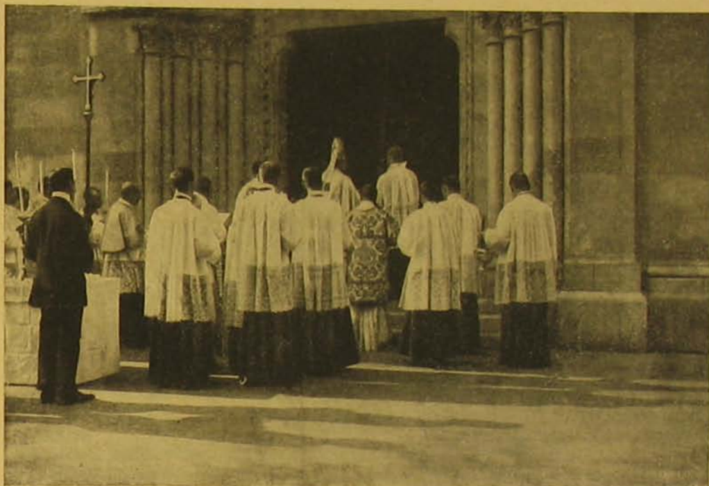
Szertartás a templom főkapujánál.