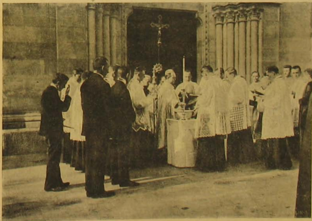
A via megszentelése.