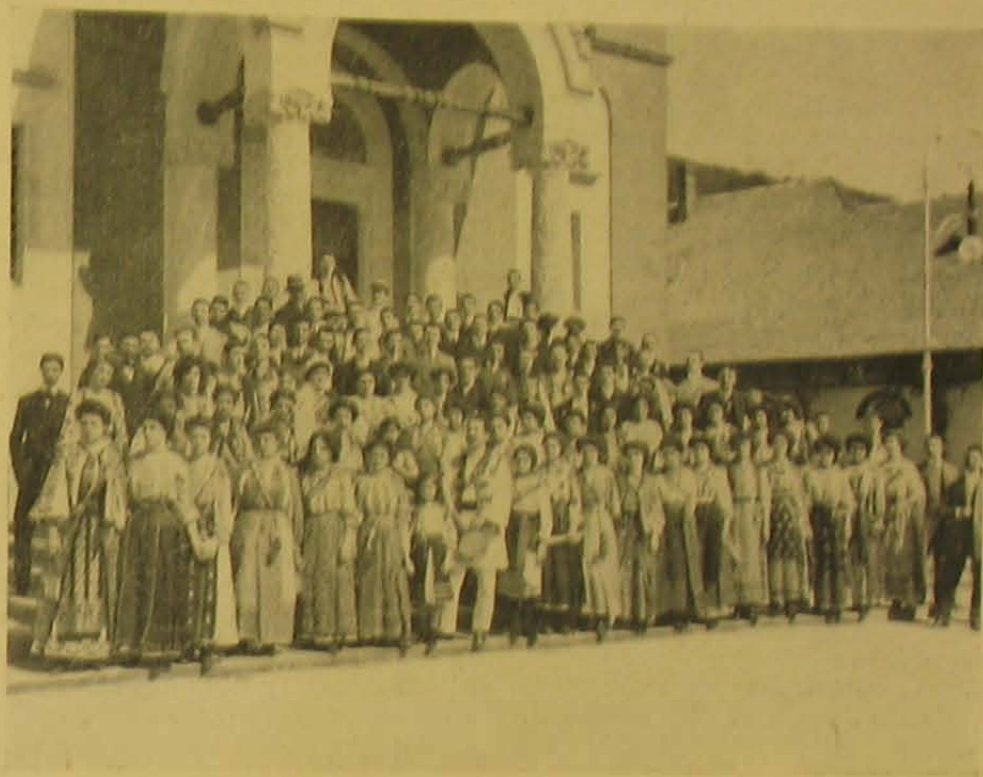
A Horn-énekkar a sinai kolostor előtt,