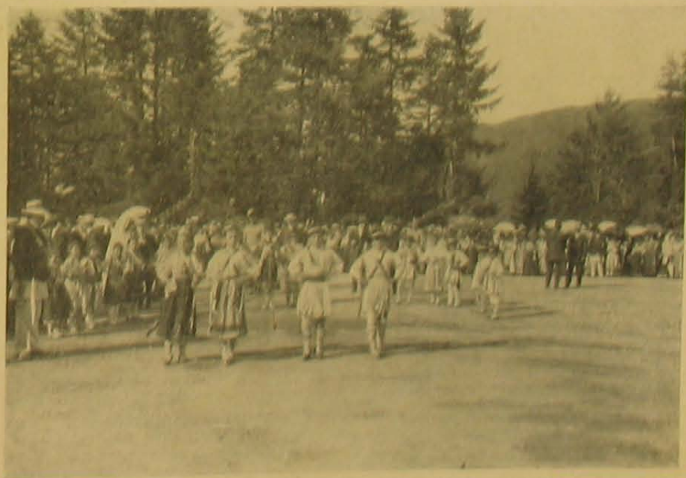
Román nemzeti tánc a népünnepen.