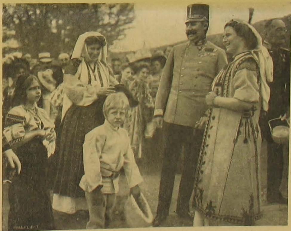
Mária román trónörökösne gyermekeivel a népünnepon, román nemzeti viseletben.