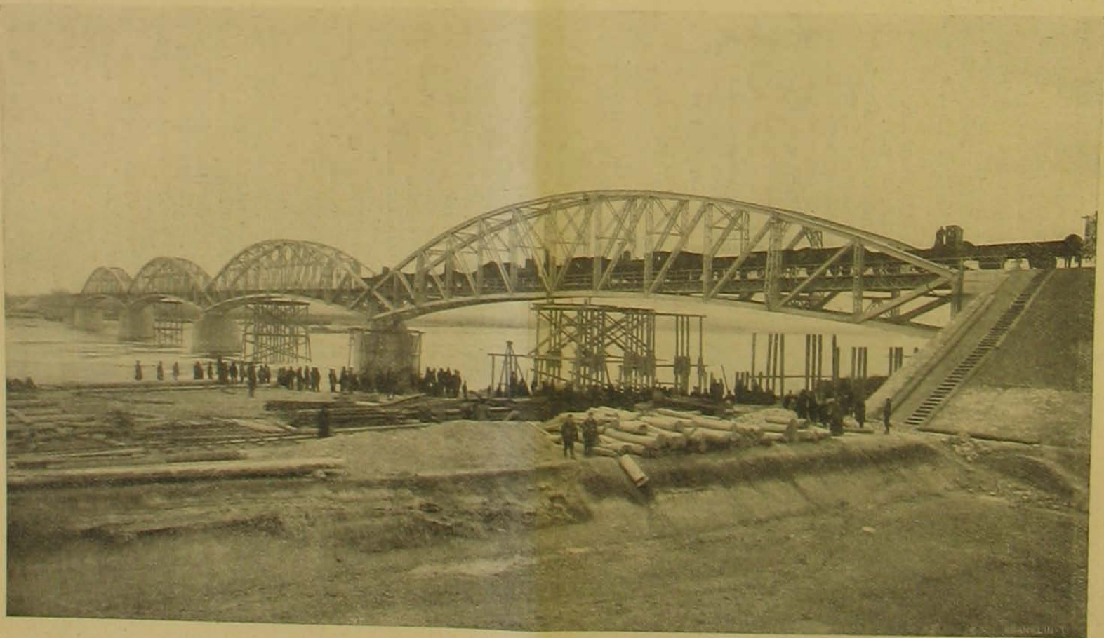
A baja-bátaszéki Dunahíd próbaterhelése.