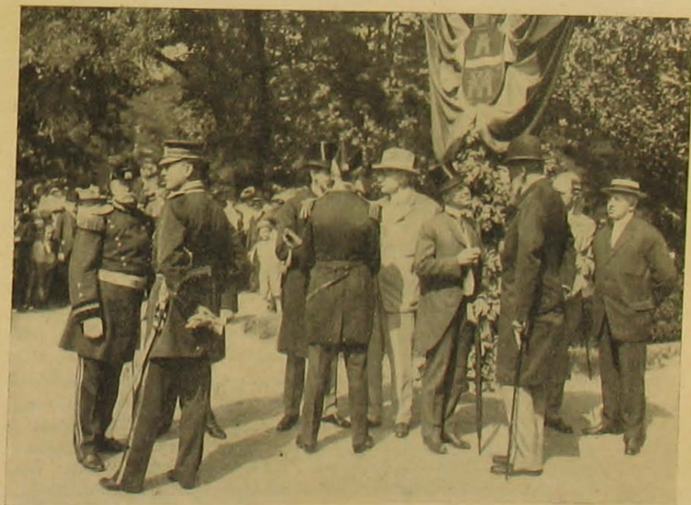
Amerikai orvosok gróf Apponyival.