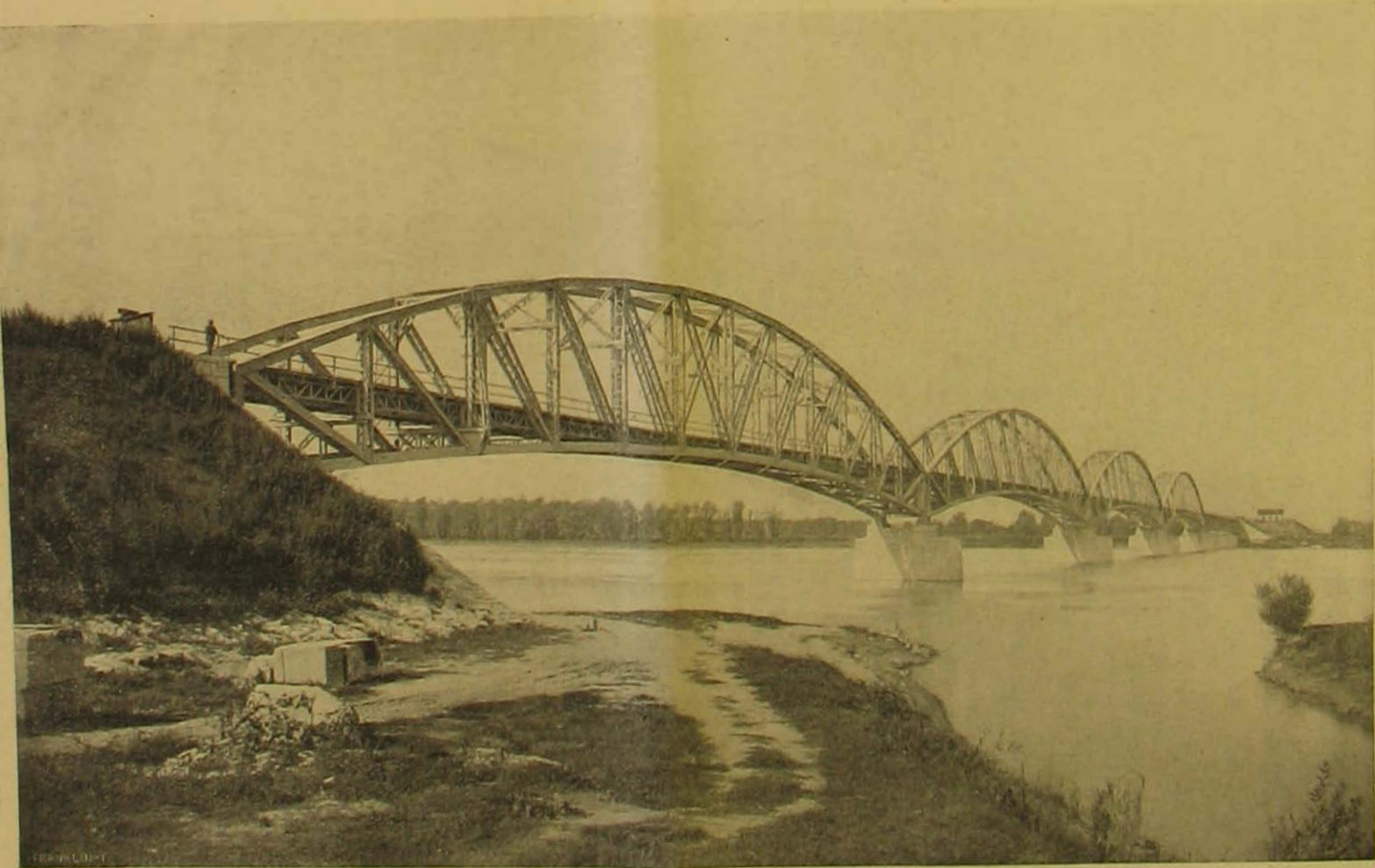
A baja-bátaszéki Dunahíd kész állapotában.