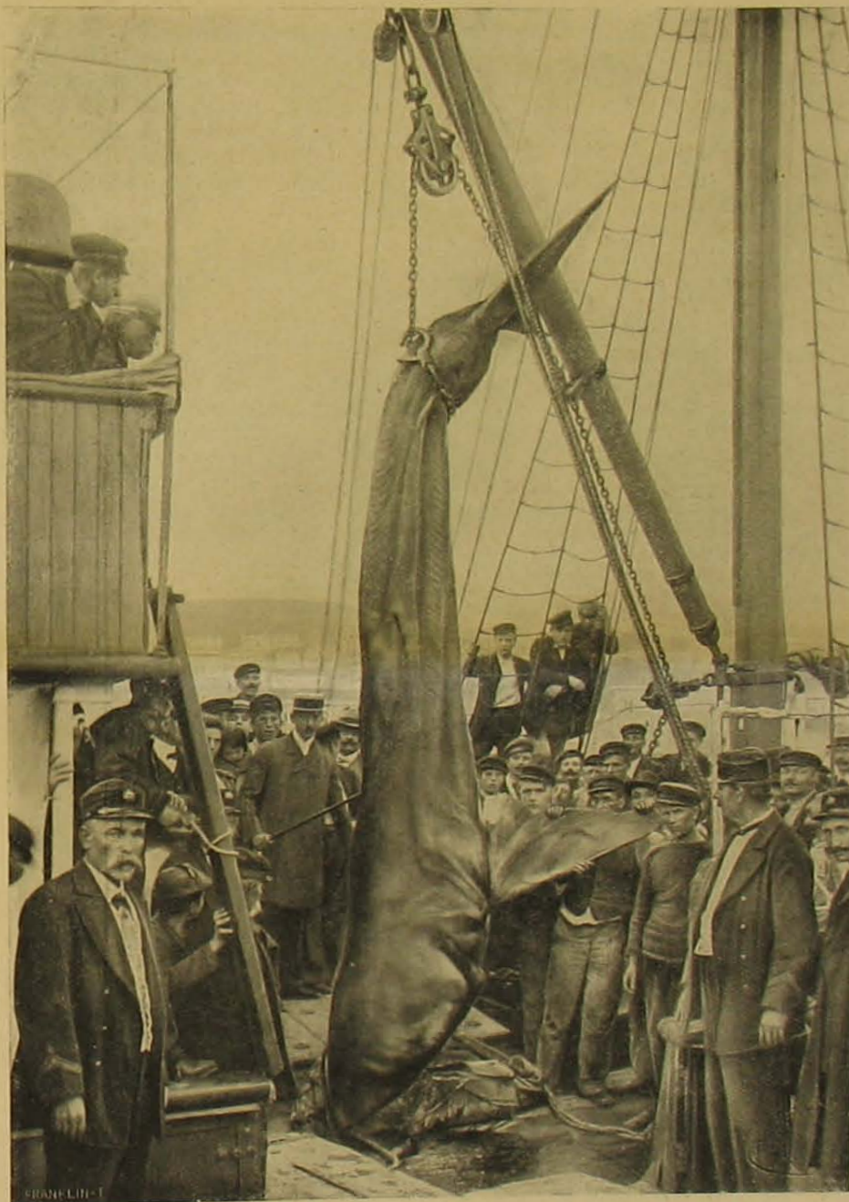
Cz.ápa'ogás Fiumében. — A czápát daruval emelik le a hajóról.

1907. évi április hó elején, egyik hetivásár alkalmával, a mint szokása szerint a vásárosok között ügyelgett, egy asszony fordult hozzá s minden feltűnés nél-