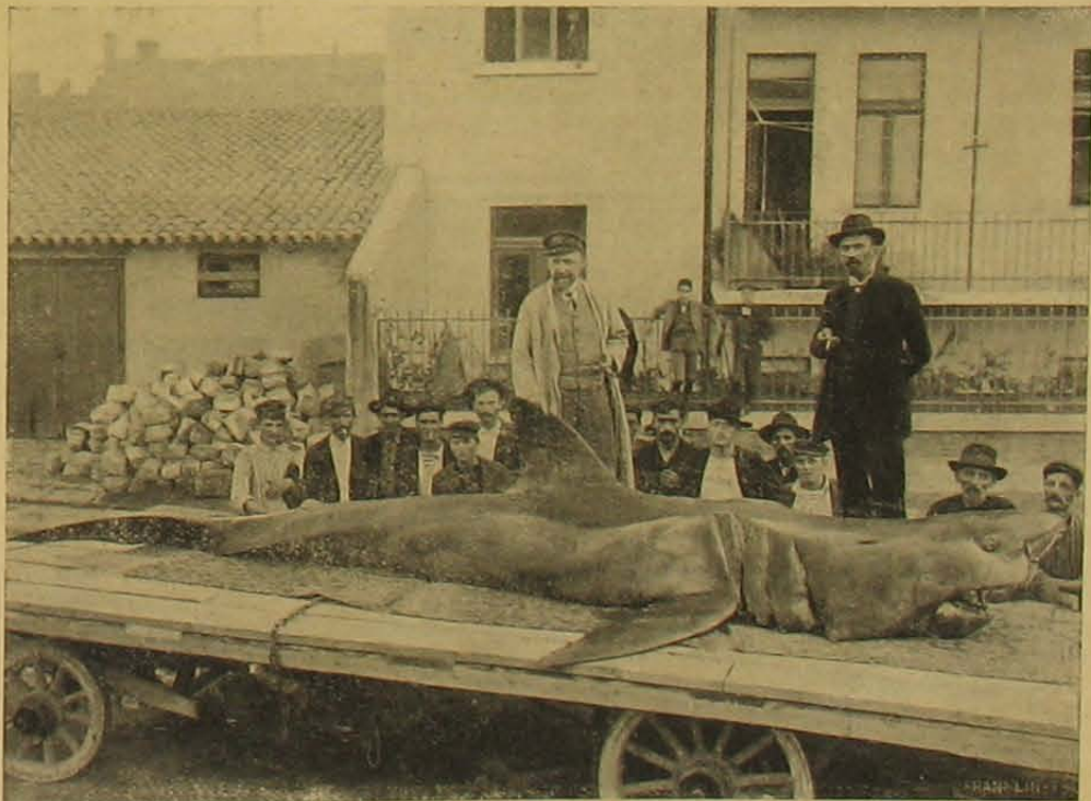
A flumei óriási czápa. — A preparált czápa utrakészen Budapest felé.