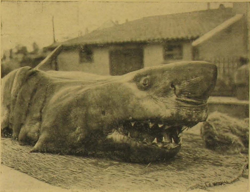
A ozápa feje.