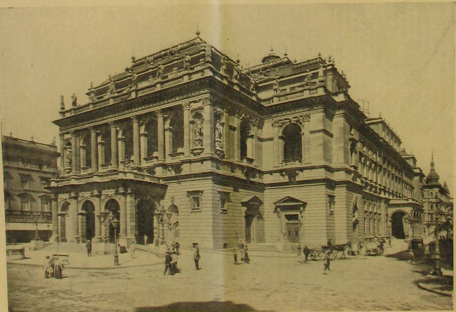
A magyar királyi operaház.