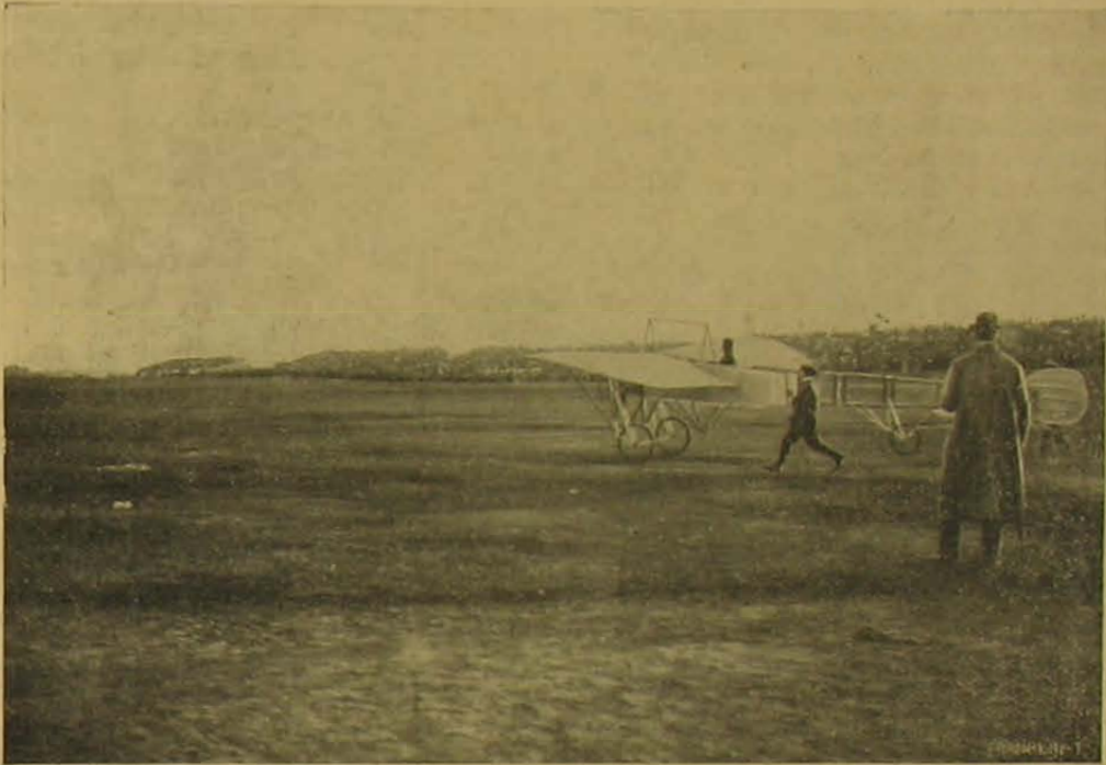
Az indítás előtt.