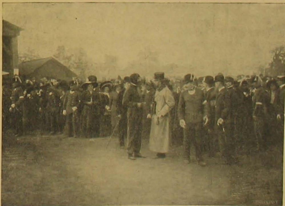
Blériot röplése Budapesten. — József főherceg Blériotval beszélget.