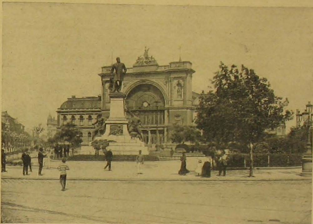
A huszonöt éves keleti pályaudvar.