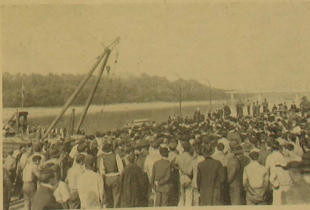
Megérkezés az újpesti hajóállomásra.