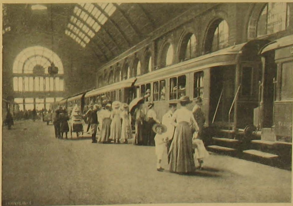
Indul a vonat.