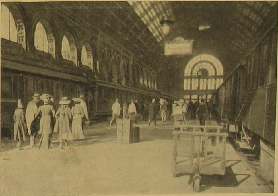
Megérkezett a vonat.