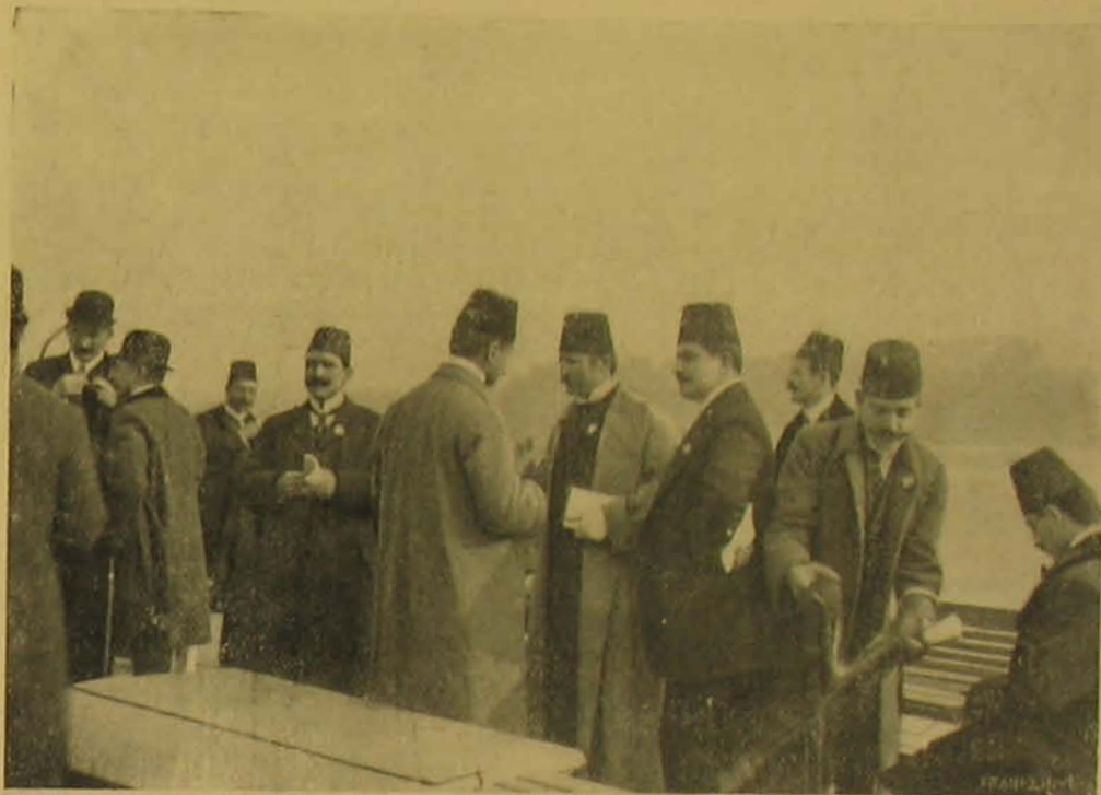
Sétahajózás a Dunán.