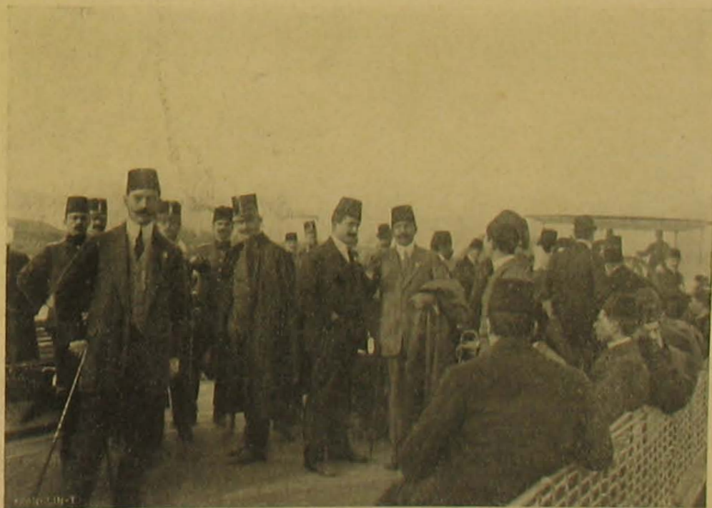
H. jókirándulás Budafokra.