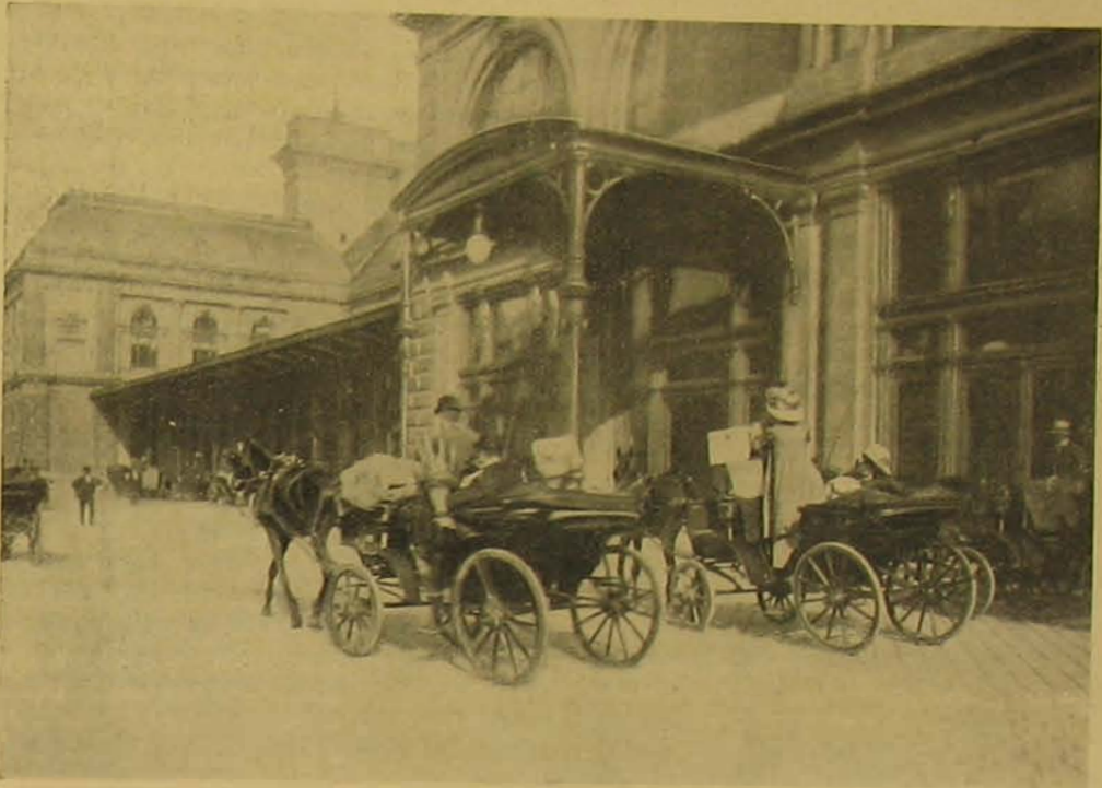
A keleti pályaudvar érkezési oldala.]