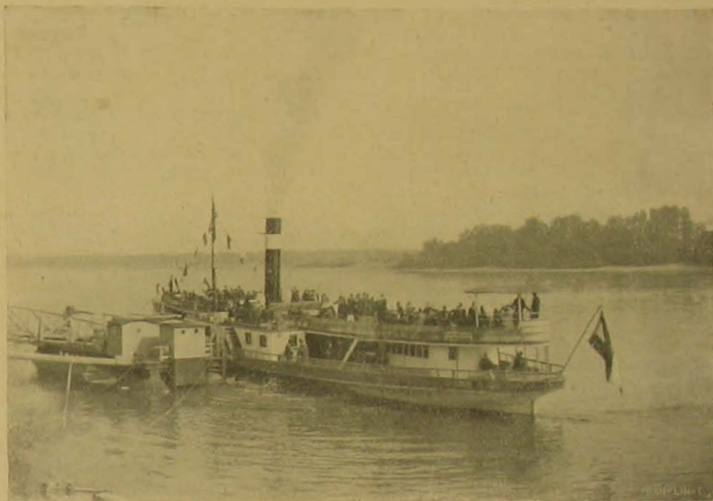
Kirándulás a Danubius hajógyárba.