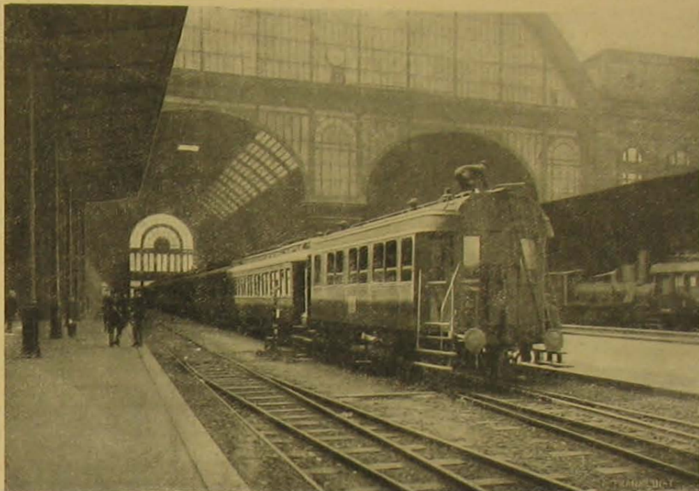
A keleti pályaudvar csarnoka.