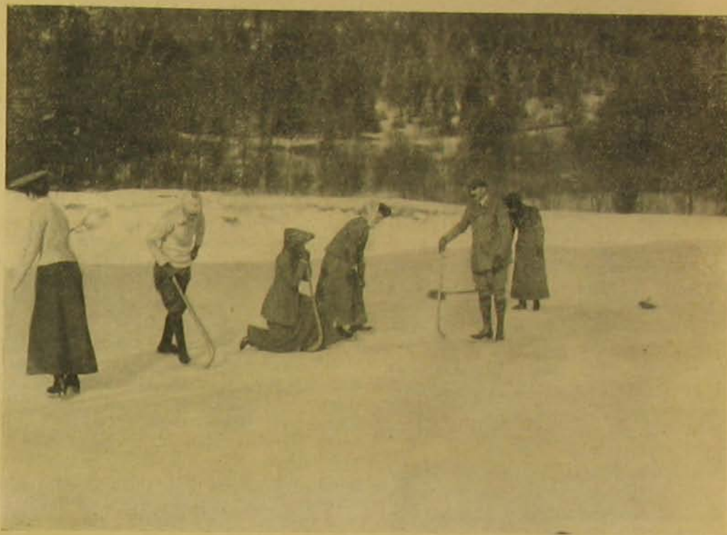
Corner. (Hibás lövés, a molyre a büntető lövés jön.)