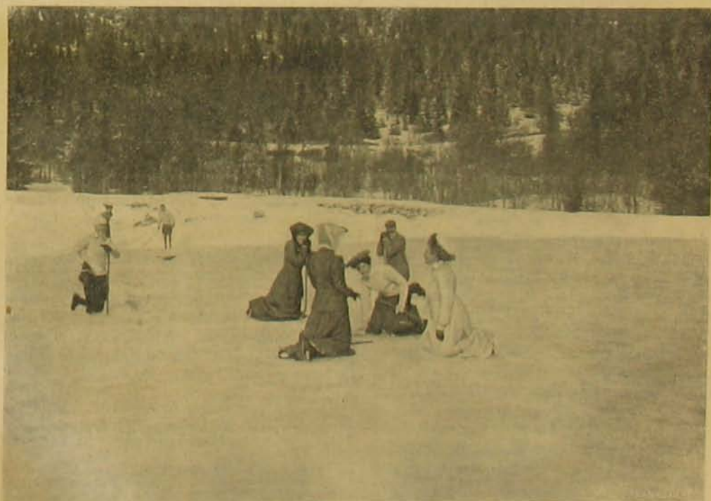
A játék vége.