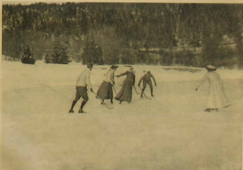
Lövés a kapuba