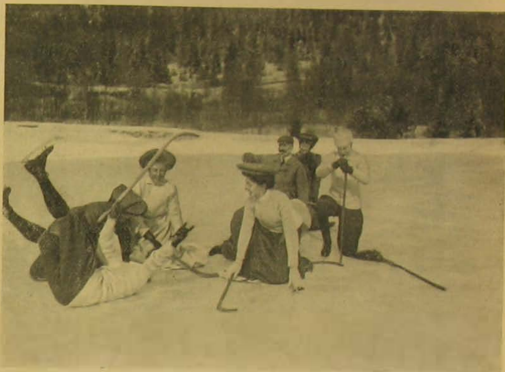
Egy kis baleset.