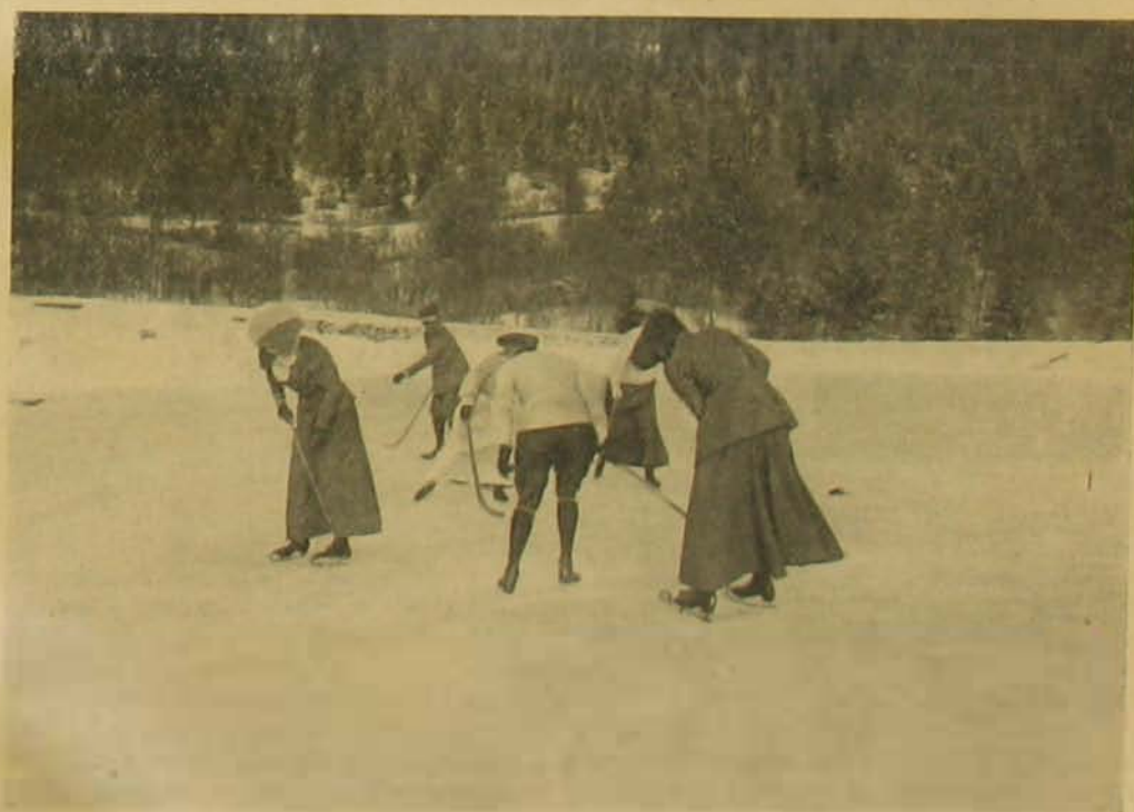
Küzdelem a labdúért.