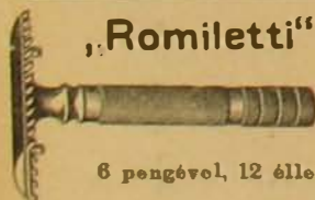
6 pengével, 12 éllel

Nagy tévedés azt hinni, hogy a poloskák petéikről ki nem irtathatók. Mióta a Löcherer-féle Cimexin poloskairtóval történtek próbák bebizonyult, hogy a Cimexin nemcsak az élő poloskákat öli meg, de a petéik a Cimexin hatásán folytán nyomban kiszáradnak s többé ki nem kelnek. A Cimexin mindenütt használható, szövetet, butort, falat vagy festést nem piszkít, foltot nem hagy. Próbauveg fecskendővel 1 kor., Nagy üveg 2,40 fill. Ahol nem kapható, oda küld Löcherer Gyula gyógyszerész Bártfá.