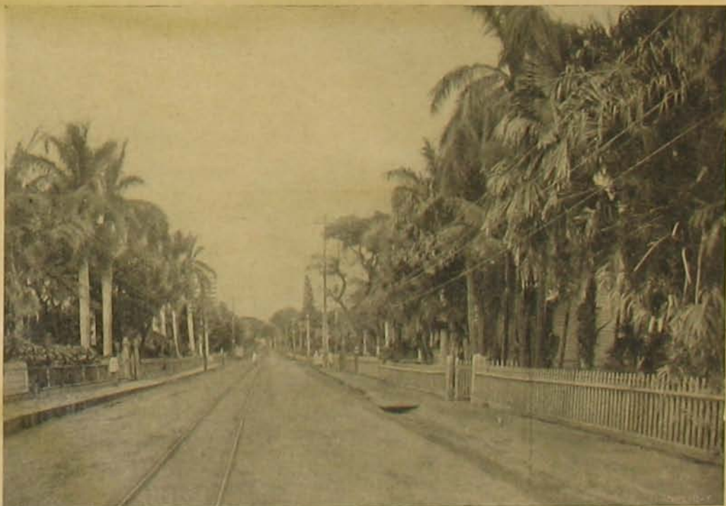
Honolulu egyik utcája.