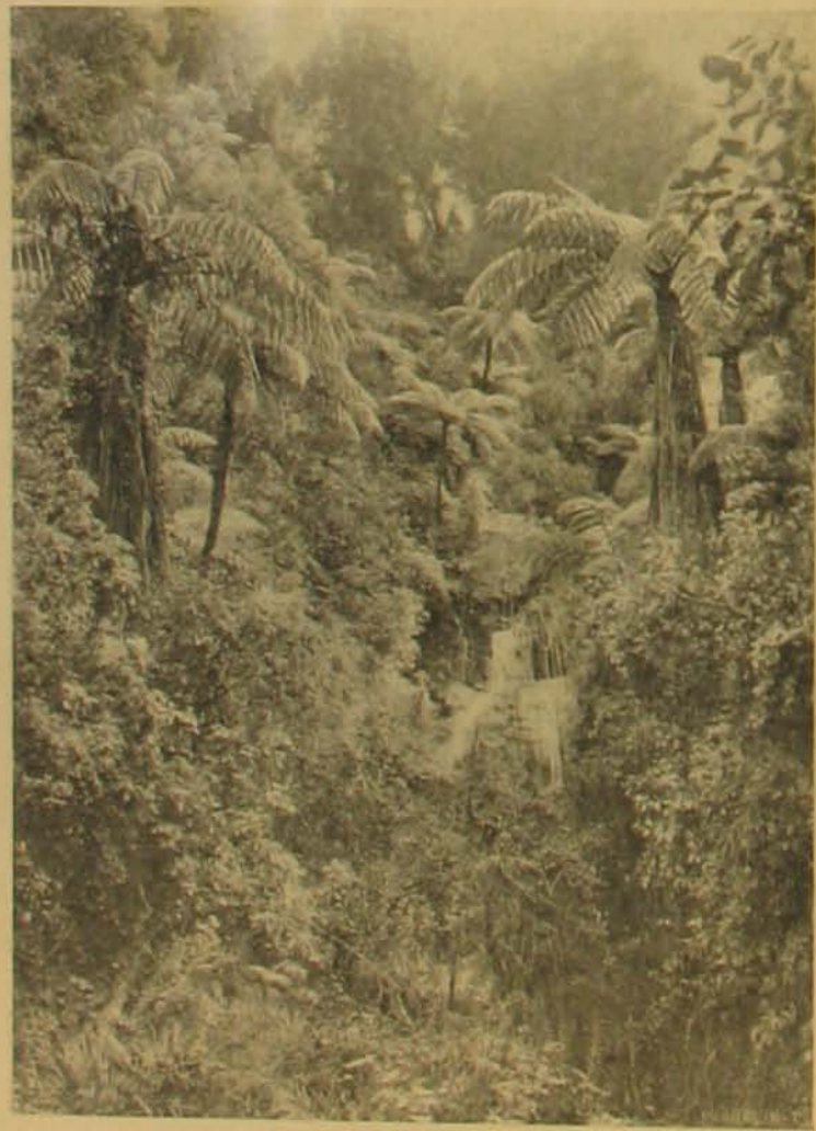
Pálmák és páfrányok egy vizesés körül.