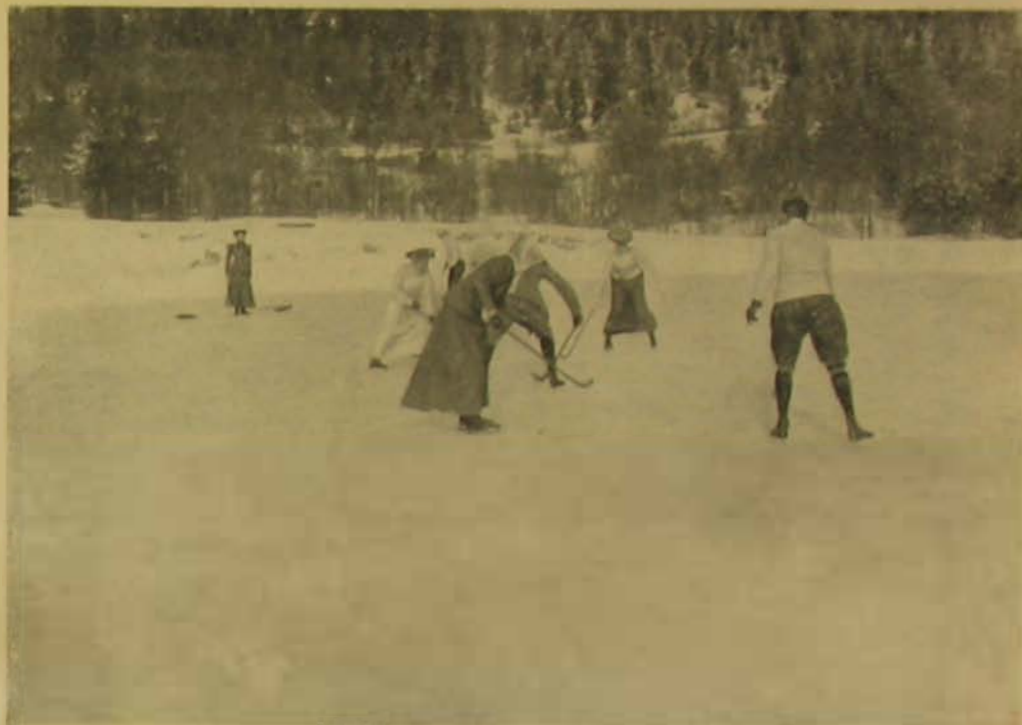
Támadás a kapu ellen.